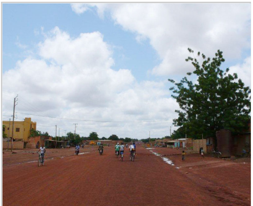
布吉納法索街道的滾滾紅土