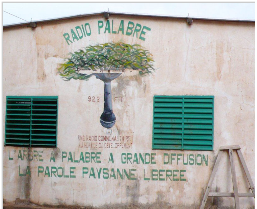
「大樹下」廣播電台，提供鄉村居民接收訊息的管道