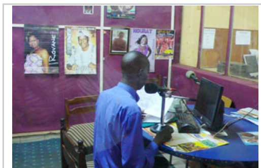
正以摩西語播報本期樂透號碼，讓鄉村居民們也可以對獎

第一站是古都古的廣播電台—"Radio Palabre"。"Palabre"意思是非洲人們在大樹下聊天、聚會的情形，這個廣播電台旨在於提供鄉村地區人民，一個接收資訊的管道，因為鄉村人民往往不識字，也沒有電視，經由收聽廣播，是最便捷的方式，我想這個電台完全符合了它名字的意義。電台老闆親自上陣，在錄音室裡現場插播，用非常清脆好聽又帶有非洲口音的法文，公布本期樂透開獎號碼。接著再換上另外一位先生，用當地摩西語再播報一遍，讓未受教育的人也能聽懂。隔著玻璃聽到廣播裡頭的聲音出現在面前，親臨現場感覺就是不一樣！