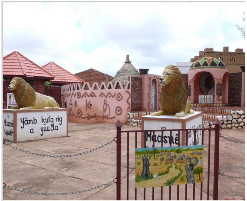
看起來有點像兒童樂園的博物館園區