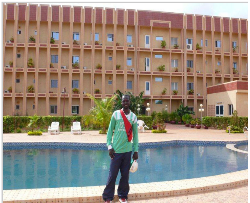
其實是嚮導先生自己想逛大飯店吧？