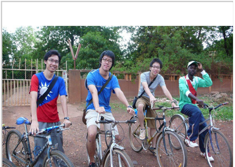
• 古都古單車之旅，在團部門口排成一列，準備出發（左一為作者）