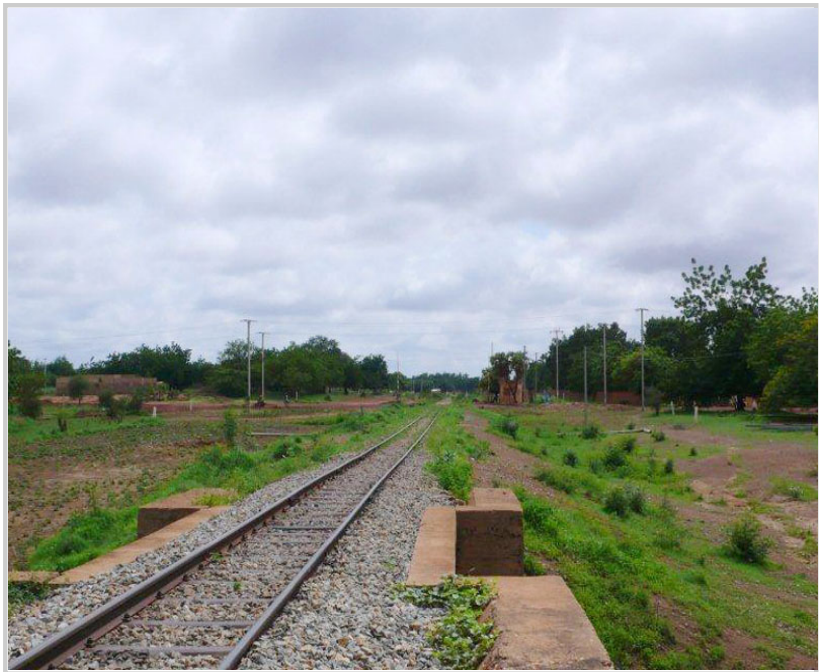
經過鐵道，大夥兒興奮爬上軌道拍照，因為一天只有兩班火車，不用怕啦！