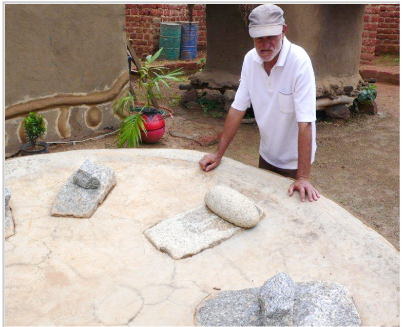
熱愛摩西族文化的法國老人帶領我們參觀博物館