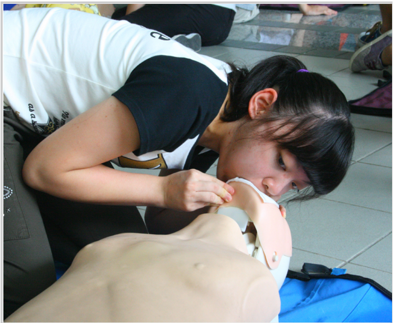
• 呼吸道異物梗塞實地演練