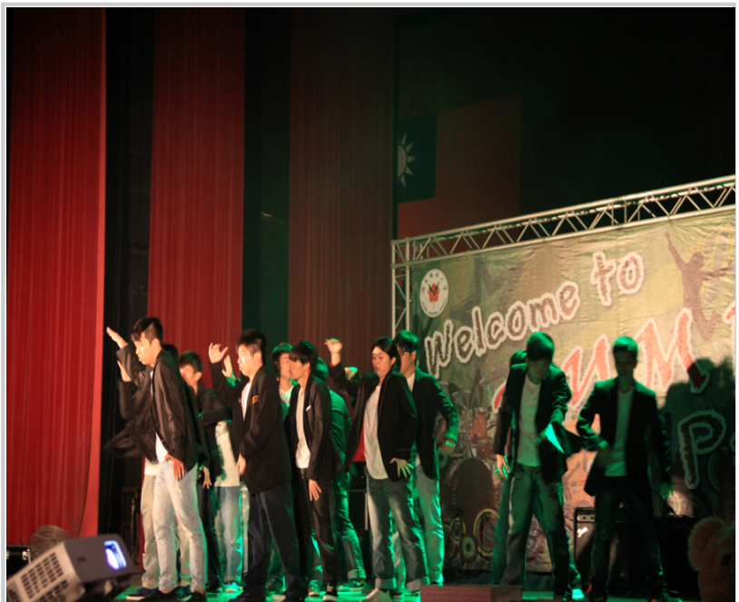
迎新晚會熱舞社表演