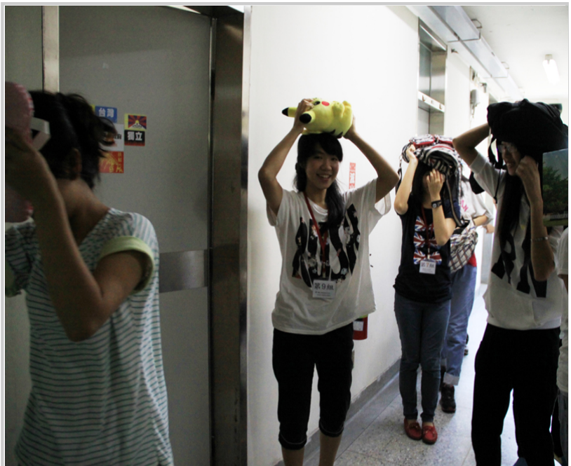
地震災害避難演練