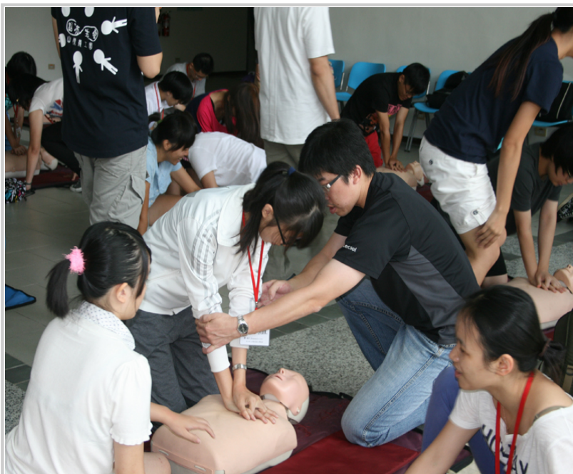
老師指導學生心肺復甦術正確方法