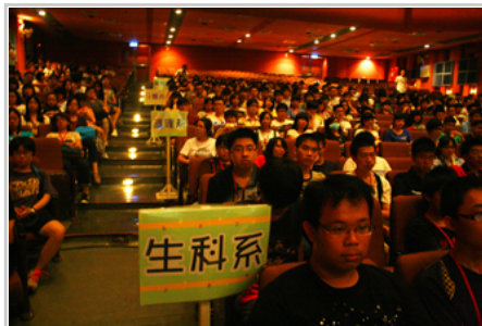
102學年度大學部新生入學指導

「102學年度大學部新生入學指導」於9月11至13日舉行。今年大學入學新生約430名。各處室於會中簡介相關業務，社團表演精彩節目，還有專題性的課程與演練。在新生入學訓練中校方將法律常識、節能減碳、性別平等觀念、交通安全教育、緊急救護訓練、防災教育融入其中。讓大學新生在剛進入學校，就能瞭解學校資源、校務規範及具有緊急救護及防災的能力。另外，社團博覽會、迎新晚會與校友講座，也讓新生接觸到多元與知性的大學生活。