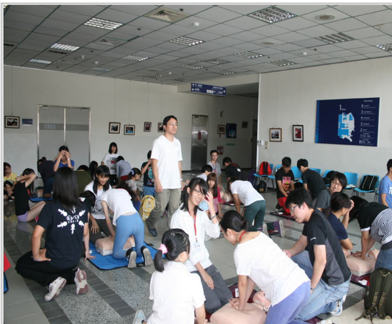
緊急救護課程訓練