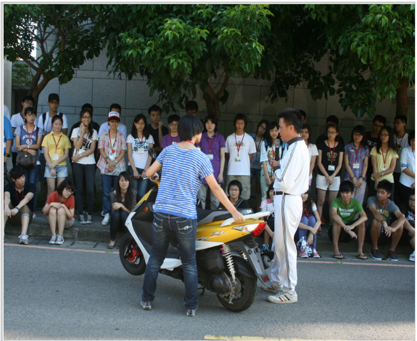
「交通安全教育」中，教練指導如何正確使用機車