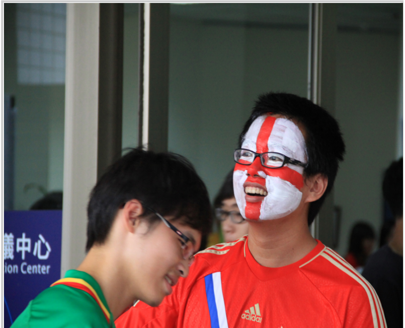
社團博覽會足球隊招募新生