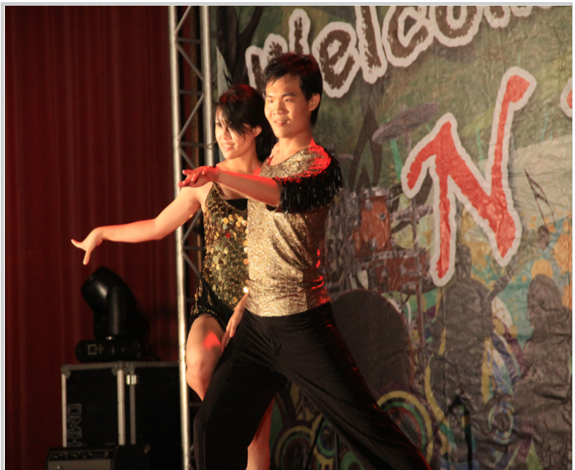
迎新晚會國標舞表演