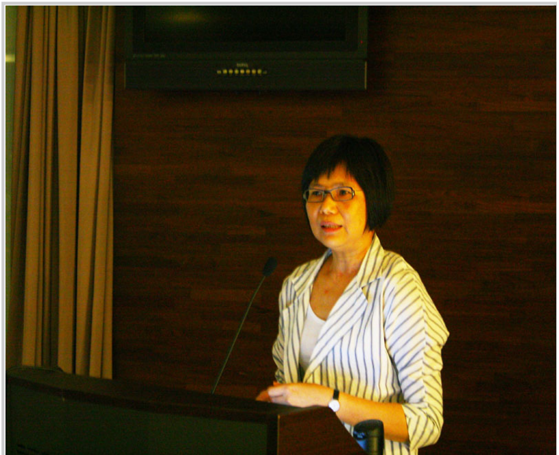
高閻仙教務長報告