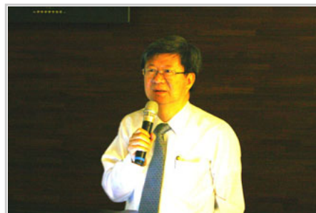
政治大學吳思華校長演講

研習營首先由梁校長致詞並介紹新任主管，再由政治大學吳思華校長發表專題演說。吳校長談到政大近年來的發展狀況時，提及了行政與夢想的關係，他說「行政」就是運用別人的資源去完成自己的夢想，行政是追求夢想的過程，有夢想，行政的角色才會有價值。他以整治校園河岸景觀、在學校設立台北市立聯合門診及邀請NSO國家交響樂團進駐政大表演等例子，說明政大如何結合台北市政府資源，建設學校，發展社區關係，實現夢想。