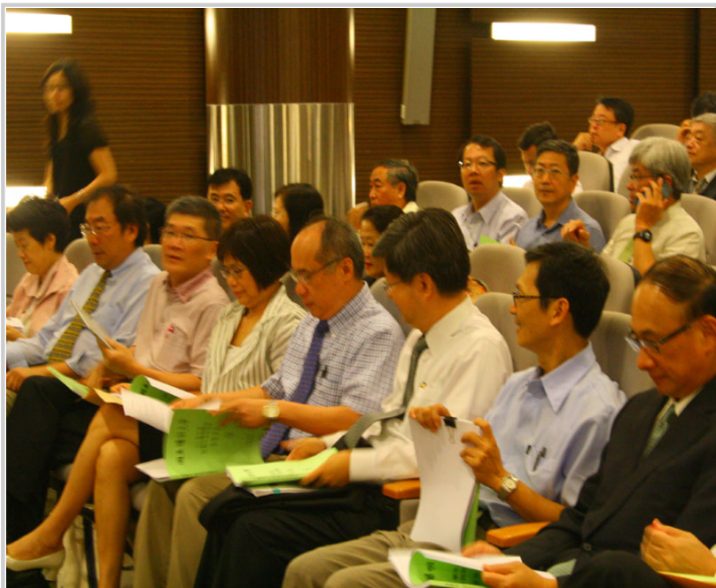
邀集全校行政及學術主管參與研習

在綜合討論時間，校長談到目前高等教育面臨的挑戰，包括少子化、周邊國家延攬人才的競爭、經費來源的穩定性等問題。還有面對高科技的挑戰，如何利用高科技資訊，提升教育品質。這些雖是危機，但也是轉機，只有運用新思維解決問題，才能在穩定中求成長，帶動學校的前進。