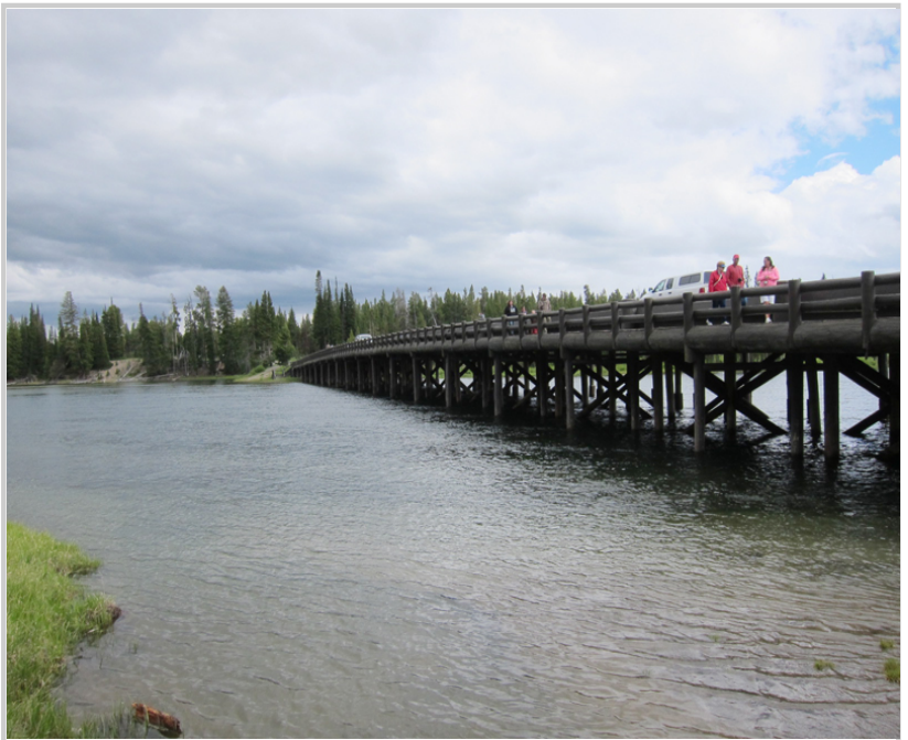
• Fishing Bridge已經不能釣魚了