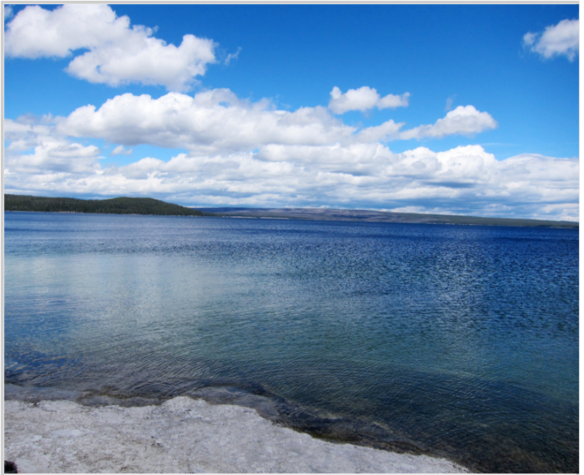
• 黃石公園的湖都超大，像海一樣美麗