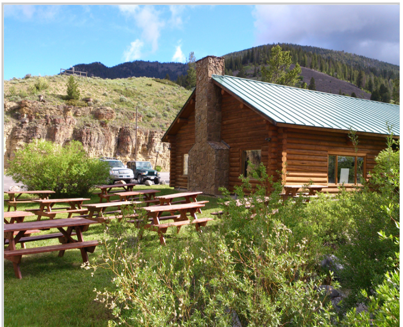
• 牧場所經營的餐廳