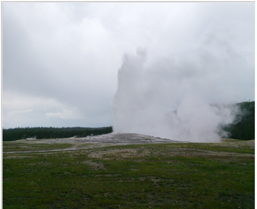
• Old Faithful 噴發狀況