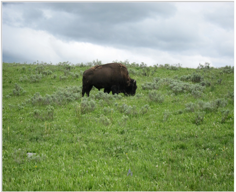
美洲野牛是黃石公園裡最常見的野生動物