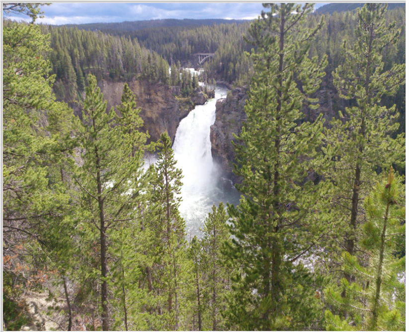
黃石公園內的瀑布