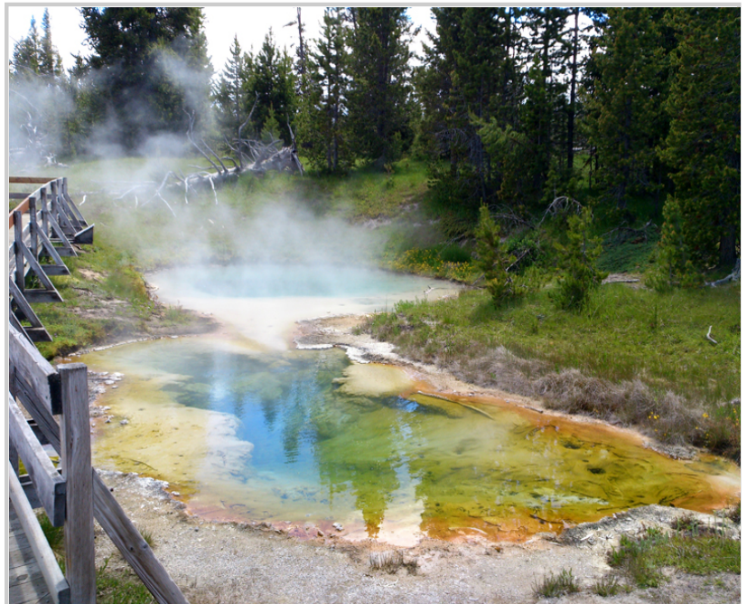
• 黃石公園內五顏六色的溫泉