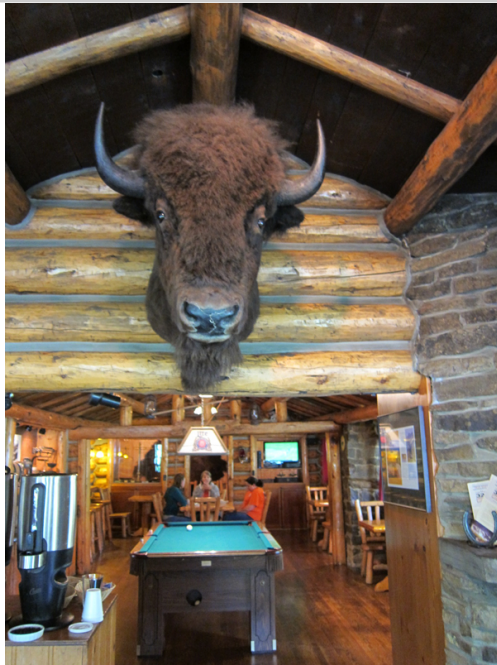
• 牧場餐廳牆上掛著美洲野牛頭