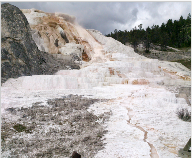
Mammoth Hot Springs · 白色的階梯是溫泉鈣化而成