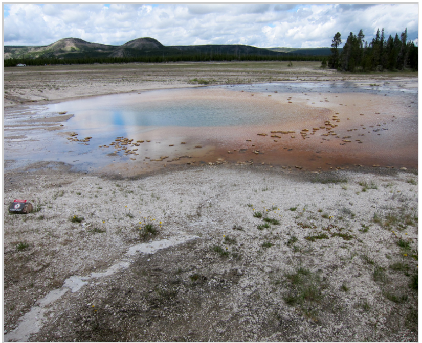
河邊到處可見間歇泉所產生的煙霧