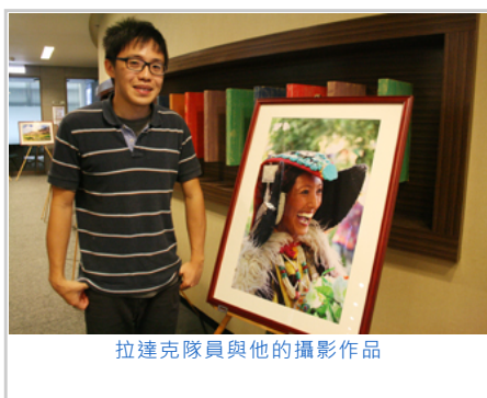
拉達克隊員與他的攝影作品

在台灣雲林服務的台西隊，設立了小記者訓練營，帶著當地小朋友認識台西的老街、古蹟安西府及寶貴的濕地生態，讓台西的孩子更瞭解及喜愛自己的鄉土。最令尼泊爾團隊印象深刻的是當地藏民族的「利他精神」，藏人用行動讓團員學習到人與人之間的相處，竟然可以如此簡單、直接與自然。這趟服務之行也讓同學開闊了人生的視野與寬度。各團隊在心得分享後，紛紛至展示教室為來賓解釋服務的過程與放映影片。