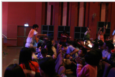
小丑與觀眾玩成一片