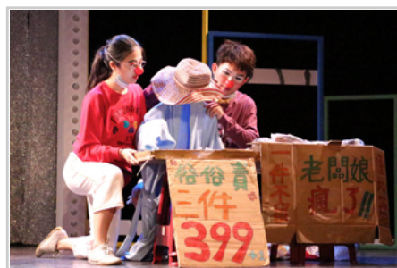
衣架媽媽託孤

當天五個小丑分別是小花、佑佑、火龍果、小屁和David，每個小丑都有自己的個性，他們利用音樂、舞蹈搭配著誇張的肢體語言，透過故事的演出，描繪人生細膩的感情。例如劇組很有創意地利用市場擺攤的道具—帽子和浴袍和衣架，演繹出一段媽媽生子又生病離世的故事。衣架媽媽託孤之情與脫離軀殼飄然而去的身影，都令觀眾心酸。有些同學眼眶紅了，有些小朋友緊緊的依偎在母親懷中，似乎也感受到那份難過。