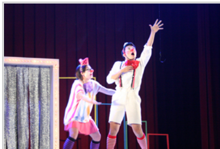
小丑誇張的肢體語言