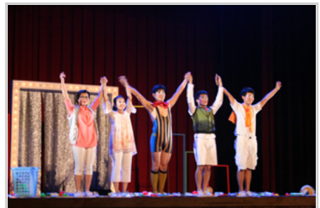
沙丁龐客劇團謝幕