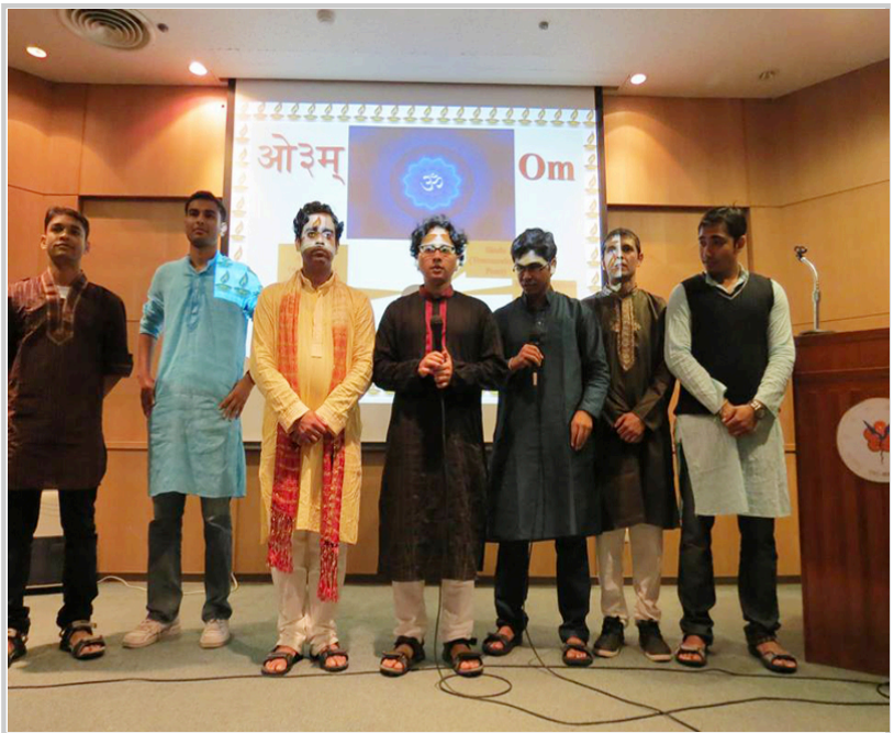
印度同學以梵文及聖歌祝禱