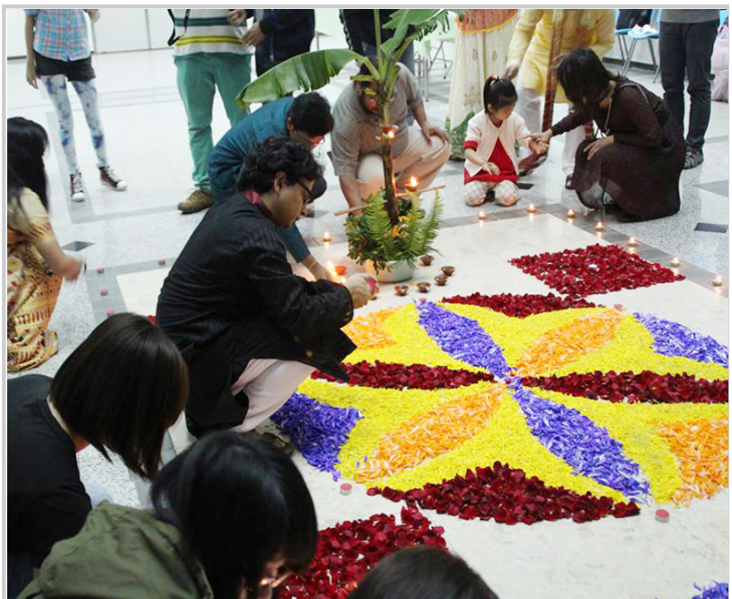
來賓進入會場開始點燈