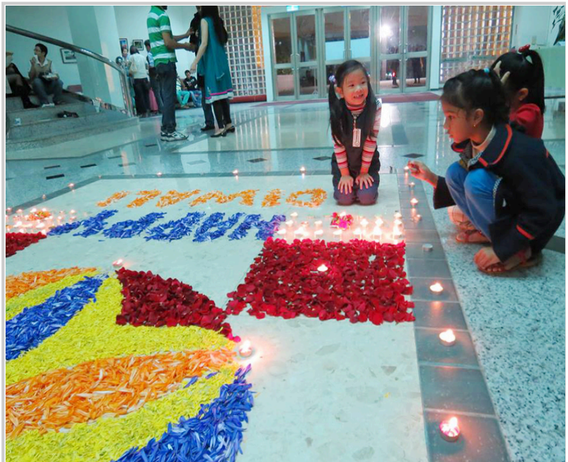
小朋友們一起點燈