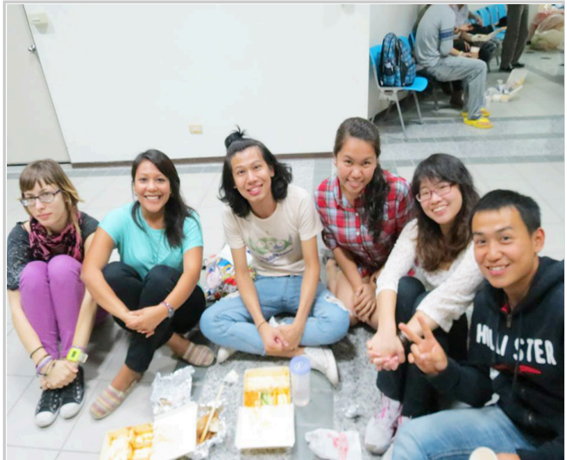
各國同學共襄盛舉