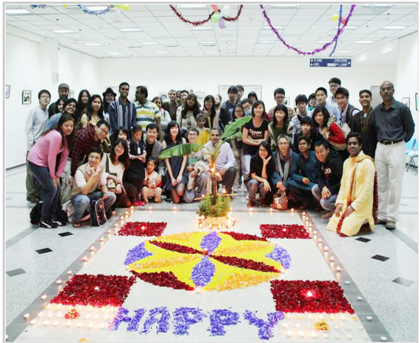
「Diwali cerebation in YM」活動