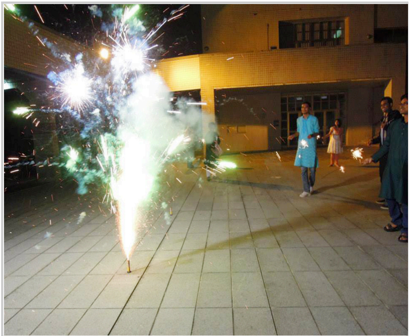
活動中心廣場煙火燦爛