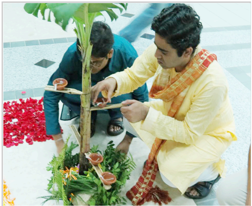
印度同學正在布置油燈