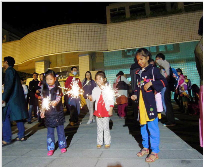
小朋友開心的玩仙女棒