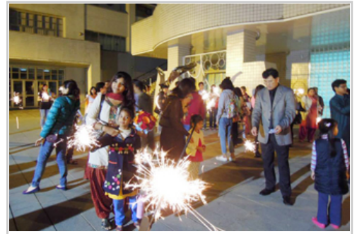
大家齊聚廣場放煙火

印度民謠與吟詩，雖然這都是他們第一次上台演出，但卻表現得可圈可點。活動中還設計了BINGO與LUCKY DRAW遊戲，得獎者可獲得芭比娃娃和黃色小鴨等獎品，讓參賽同學非常開心。最後節目在印度國歌演奏下結束，大家齊聚於活動中心戶外廣場開始放煙火，這時無論是國內外友人還是大朋友或小朋友都玩得很盡興，也體驗到印度排燈節的快樂與喜悅。