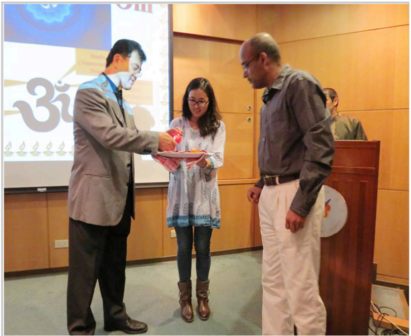
宋國際長以印度傳統儀式點燈