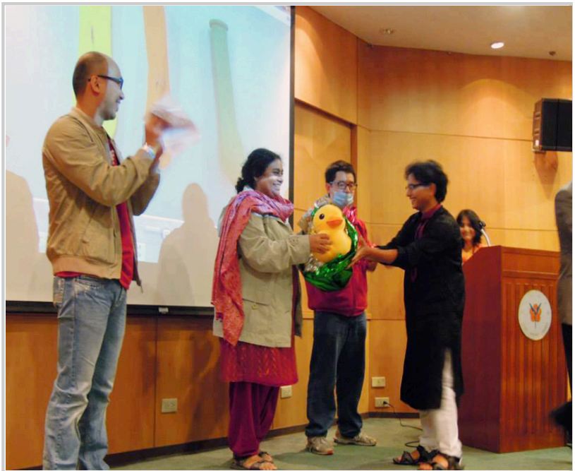
頒獎給遊戲比賽獲獎者