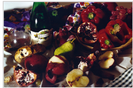
彩色靜物 ( 攝影作品 )