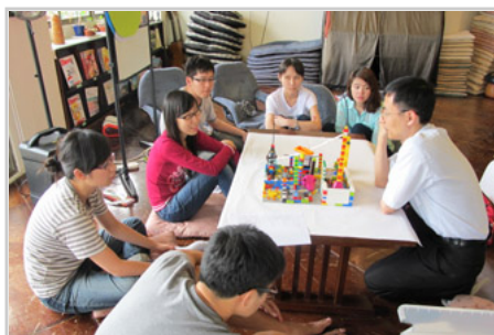
同學、老師分享與提問