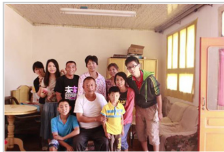
攝於壽盛同學家中。曹家是傳統農戶， 全家大小都相當熱情地招呼我們