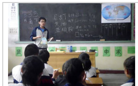
來自台灣清華大學的志工同學，正在宣導菸害的可怕

但短短幾天的交流中，還是使孩子們對於原本根深柢固的想法，產生了一些動搖。臨別的時候，一個孩子偷偷問我道，她一直覺得台灣是中國的一部份，不知道這樣正不正確。那當下，我很猶豫該怎樣回答她。不過我知道，如果她能接觸到更多不同資訊與知識，總有一天她會慢慢明白的。於是，最後我選擇期勉她，同時也自我勉勵，能懷抱著更加寬廣的胸襟，去接納這個世界的各種人、