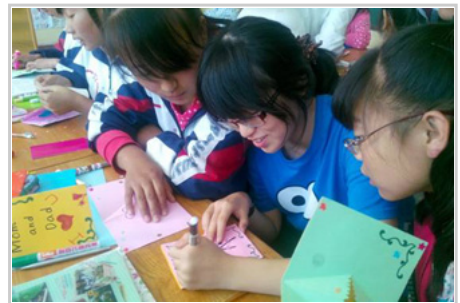
營期適逢台灣父親節，教導同學們製作立體卡片 ，表示對家人的感謝