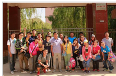
與皋蘭中學的老師們在校門口合影

士農工商的價值判斷，讓當地人從來不拘泥於克紹箕裘，反之，希望下一代能透過讀書、學習而翻身。家訪時，一位長者語重心長地說道，他希望孫子能好好念書，將來不再局限於黃土高原上代代相傳的田地，而是能到沿海都市討生活。老先生還舉了一個遠房晚輩在外商公司工作的例子，眼中滿是欽羨的目光。從科舉制度創立以來的考試選人傳統，好像在華人社會裡已經根深蒂固了。