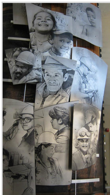
巴拿馬運河博物館中的無名英雄畫像

當時擔任美國總統的西奧多·羅斯福 ( Theodore Roosevelt，人稱老羅斯福總統 ) 意識到運河的重要性，便使用外交手段試圖接管這條重要的運河。1903年11月，美國策動巴脫離哥倫比亞獨立，成立巴拿馬共和國。11月18日，美巴簽訂《巴拿馬運河條約》，美國取得「永久使用、佔領和控制巴拿馬運河」的權利，隨後更把持了運河區的行政、司法、警備、鐵路和財政等，使運河區成為名副其實的「國中之國」。1977年，美國同意在1999年將巴拿馬運河的管理權還給巴拿馬為止，這個條約始終是兩國之間外交爭論的主題。