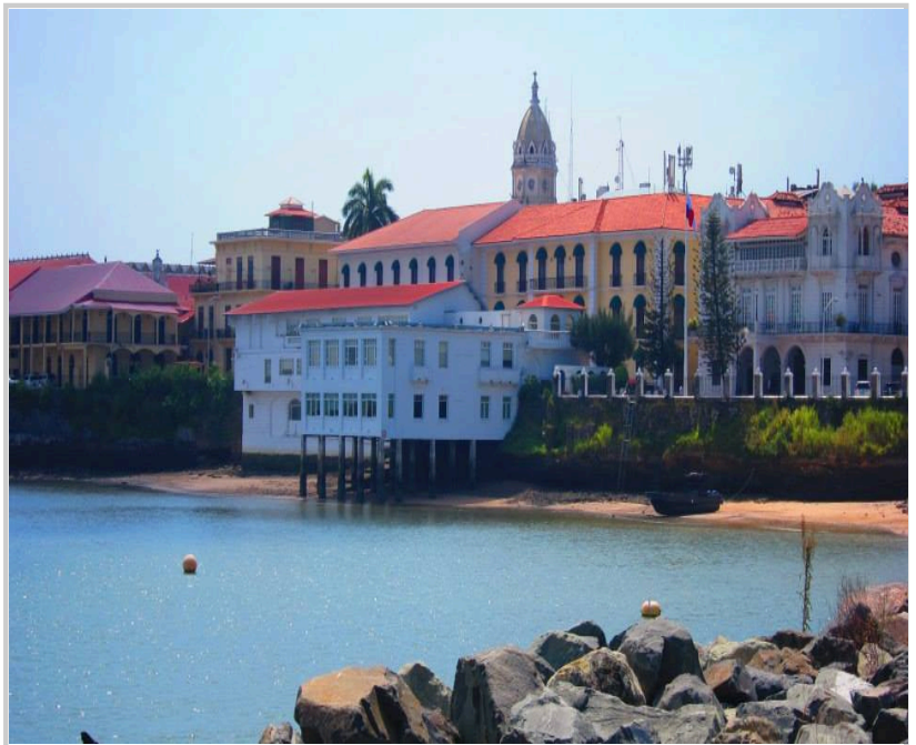
遠處觀望總統官邸