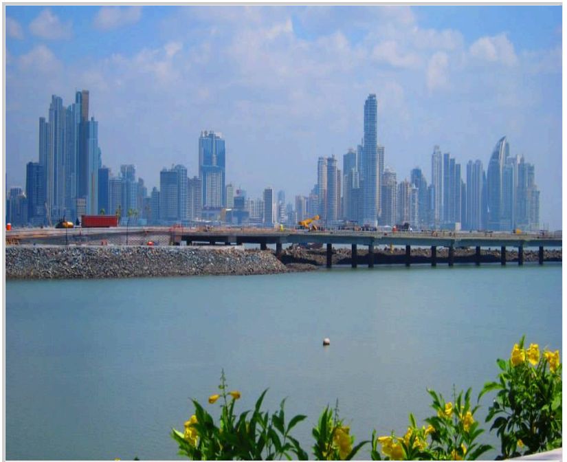
首都巴拿馬城內高樓林立，經濟實力不可小覷