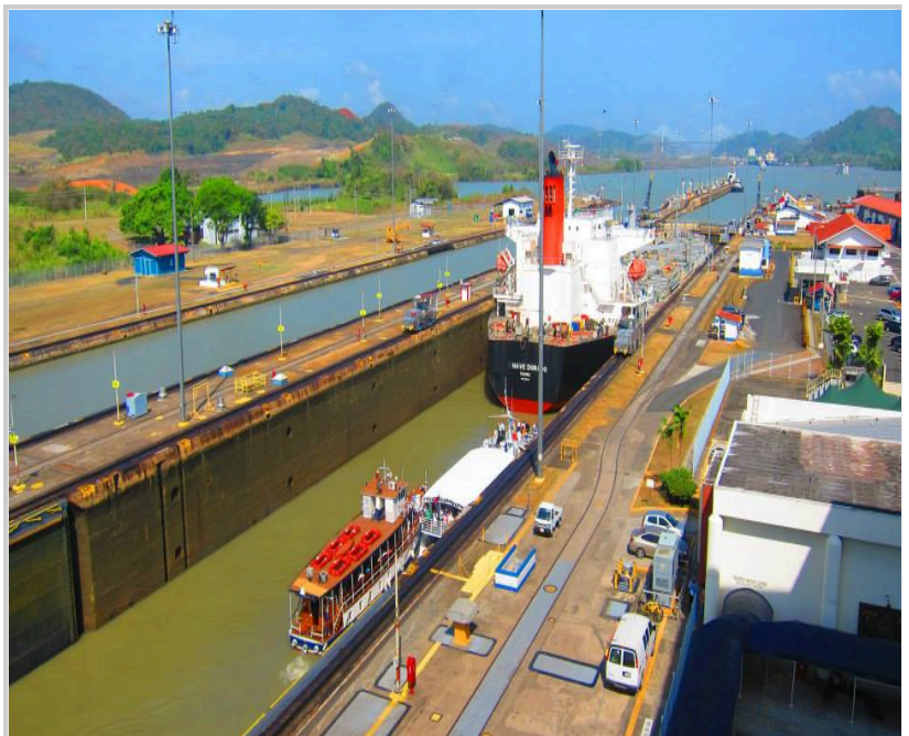
這艘貨輪通過運河，至少要付出百萬台幣的過路費