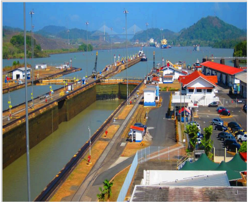
巴拿馬運河興建於1914年，全長約80公里，被譽為世界奇觀之一