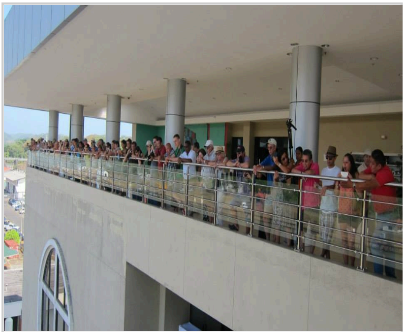
觀光客們居高臨下，等待觀賞船隻通過運河的過程