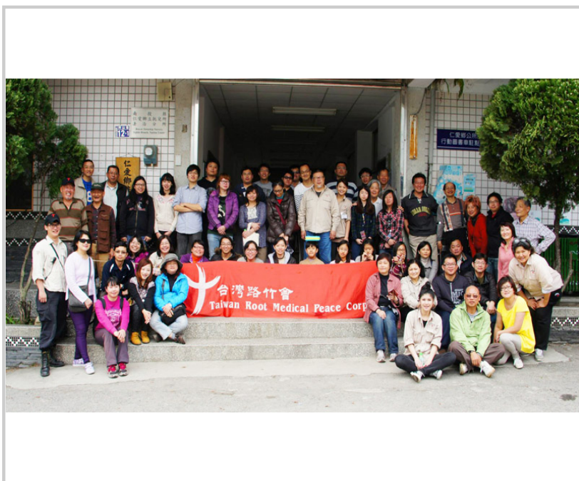
結束時開心大合照