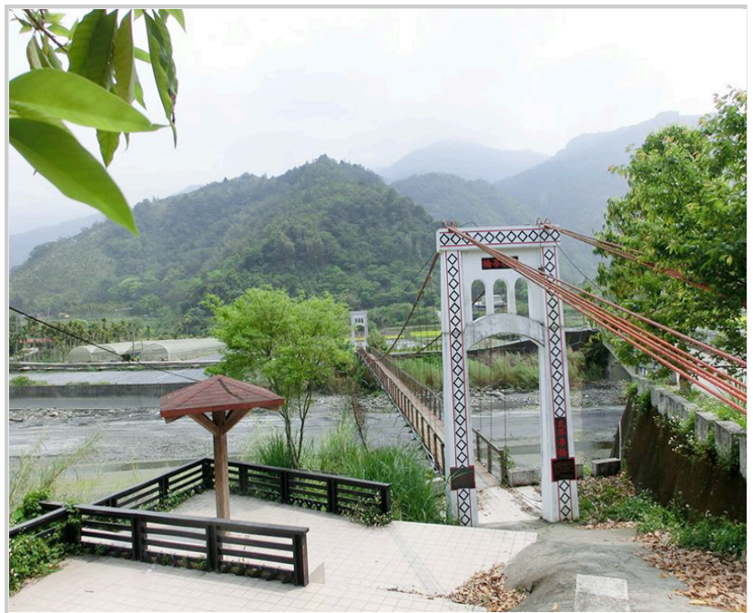
忙完後午餐前的遊走