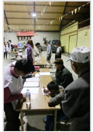
夜晚的義診別有一番風味

看著這位同行朋友在無奈的神情中敘說這件事，我也一時無語。想想會長當初的立會宗旨，誓為山上居民提供全方位的協助，但執行上似乎沒有原本想像的這麼簡單。第287次的義診想來不是隨口報出的數字，這麼多次的服務究竟有多少實際效益。當然不能否認還是有願意捧場的原民朋友，但我發現像這位來抱怨的村民仍有不少。就我的角度來看，醫療資源是有限的，像手術或高階器材等高階醫療要搬上山是比較不切實際的作法。連台灣這樣地狹人稠、醫療密度堪稱全球頂尖的地方，仍有人民為此抱怨，讓我不禁對於其他國家的情況感到好奇。我在想，努力不見得會有收獲和回報，也絕無可能得到所有人的掌聲，但是只要知道是對的、該做的，盡力去完成就是了，否則沒有一件事可成了！