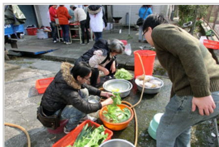
自給自足的野炊組

你知道嗎？義診當天的集合時間是凌晨二點！或許是很多台北朋友正挑燈夜戰的時刻，但卻是我們啟航的吉時。在除了司機外其他人都混噩不清中，我們循著蜿蜒山路、破開霧靄橫煙，一路到達第一個目的地：平靜部落。這次義診的部落分別在北邊的平靜部落，以及南邊的松林、萬豐部落和武界部落。甫達定點，大家趕緊下來呼吸新鮮空氣，動動一路顛簸而渾身酸疼的身體，在晨光山色中，架設起醫療站和物資中心，準備為當地的居民提供服務。