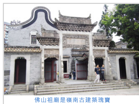
佛山祖廟是嶺南古建築瑰寶

佛山祖廟位於中國廣東省佛山市，是一座供奉道教玄天大帝的神廟，同時也是一座博物館。佛山祖廟建於北宋元豐年間（1078年—1085年），至清朝初年逐漸成為一座體系完整、結構嚴謹、具有濃厚地方特色的廟宇建築。光緒二十五年（1899年），祖廟大修，形成今日的祖廟建築群，佛山祖廟與肇慶悅城龍母廟、廣州陳家祠合稱為嶺南古建築三大瑰寶。