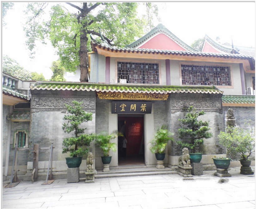
紀念武學宗師的葉問堂