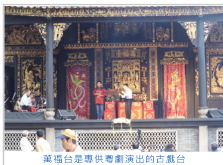
萬福台是專供粵劇演出的古戲台

搭程廣州地鐵再轉廣佛線，在祖廟站下車，交通方便。祖廟位在佛山市的市中心，進入祖廟大門，映入眼簾的是紅牆綠瓦，亭廊嵯峨，雕梁畫棟，綠蔭蔥蘢的景象。祖廟建築本身就具有重要的文物價值，在建築物屋頂上都是惟妙惟肖的精美木雕或陶塑瓦脊，內容多是戲劇故事或神話傳說，有「姜子牙封神」、「哪吒鬧海」等，非常傳神。廟內陳設有數十種銅器及鐵器，包含銅鏡、銅鼎、銅鐘，大型鐵鑄立像，鐵鑄瑞獸、鐵炮等。這些陳列品反映了明清時期佛山高超的工藝技術。