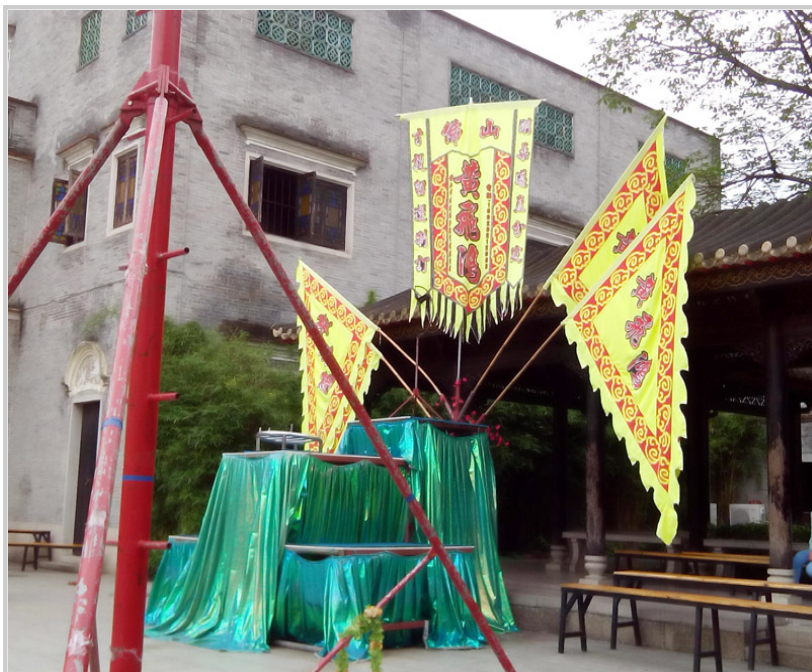
黃飛鴻紀念館內的舞獅台