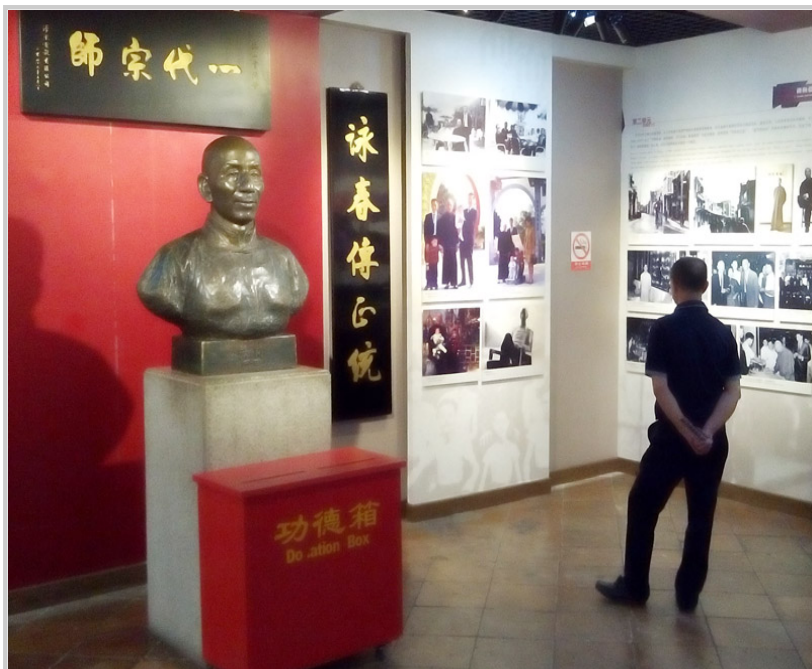
葉問堂內陳列歷史文物及雕像