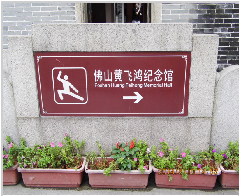
黃飛鴻紀念館指示牌