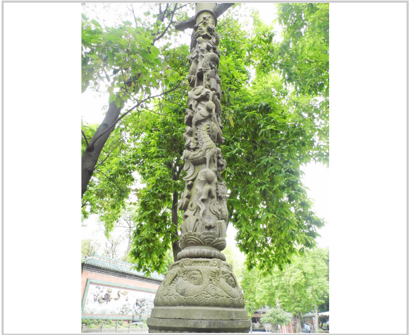
園內的石雕藝術品