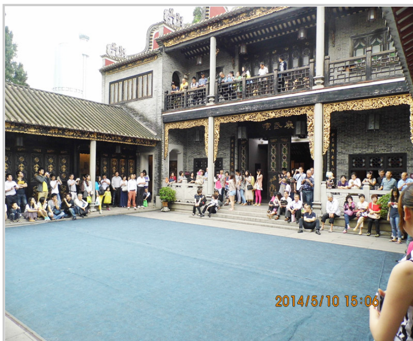
演武廳前的廣場常有武術表演