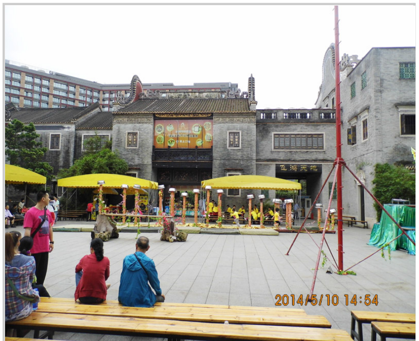
黃飛鴻紀念館園內景觀