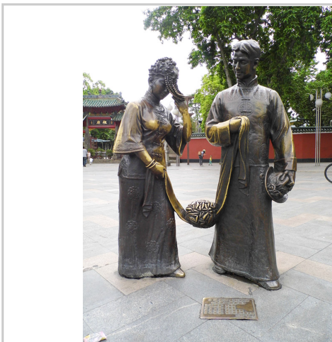
大型鐵鑄立像，展現高超工藝技術