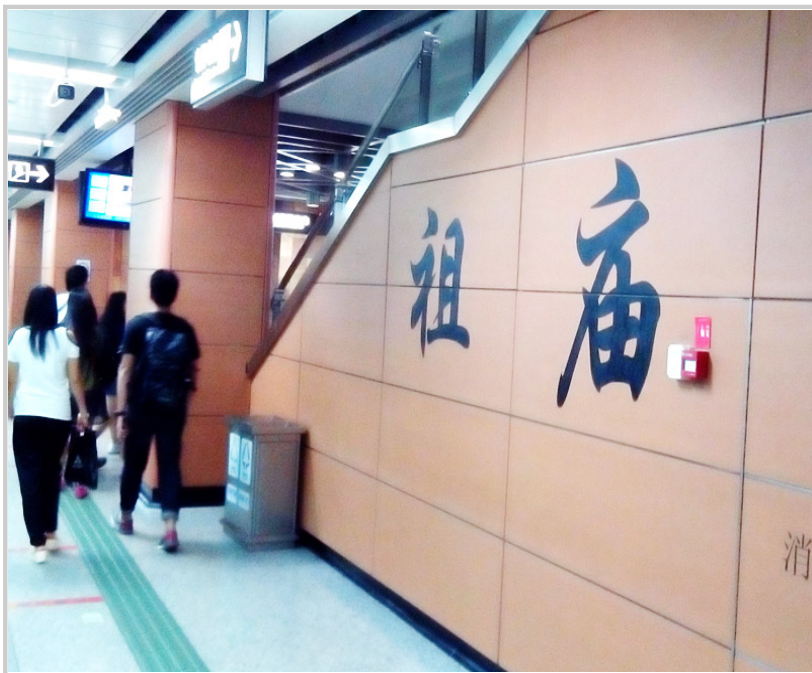
搭程廣州地鐵再轉廣佛線，在祖廟站下車，交通方便