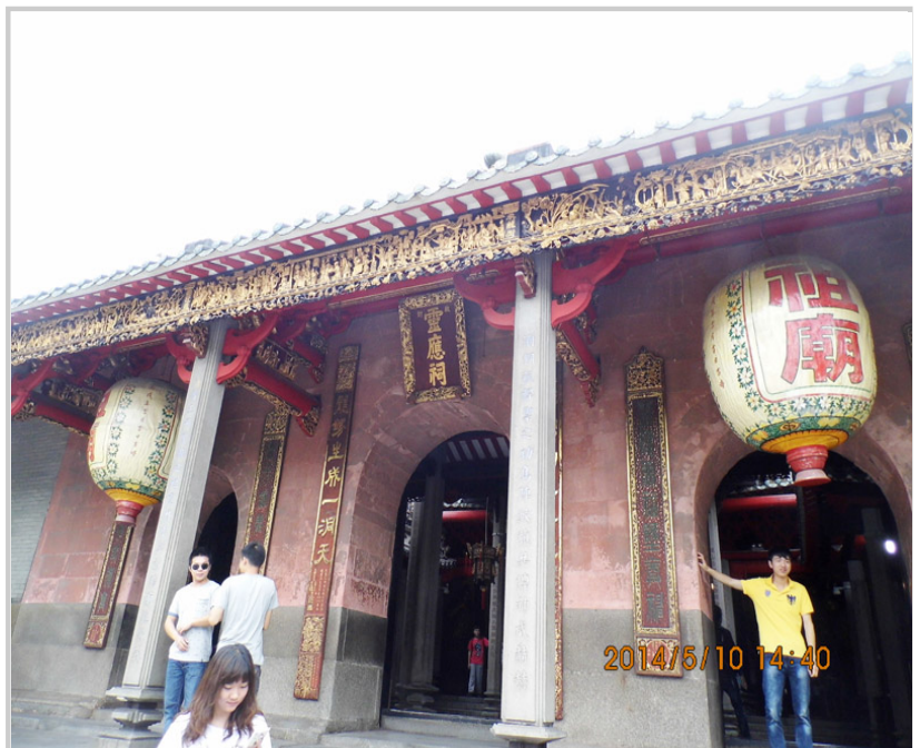
祖廟是佛山人的信仰中心