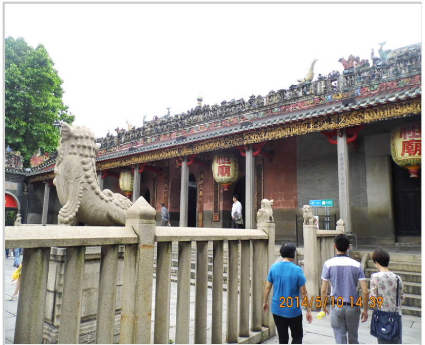
屋頂建築處處可見精美木雕或陶塑瓦脊