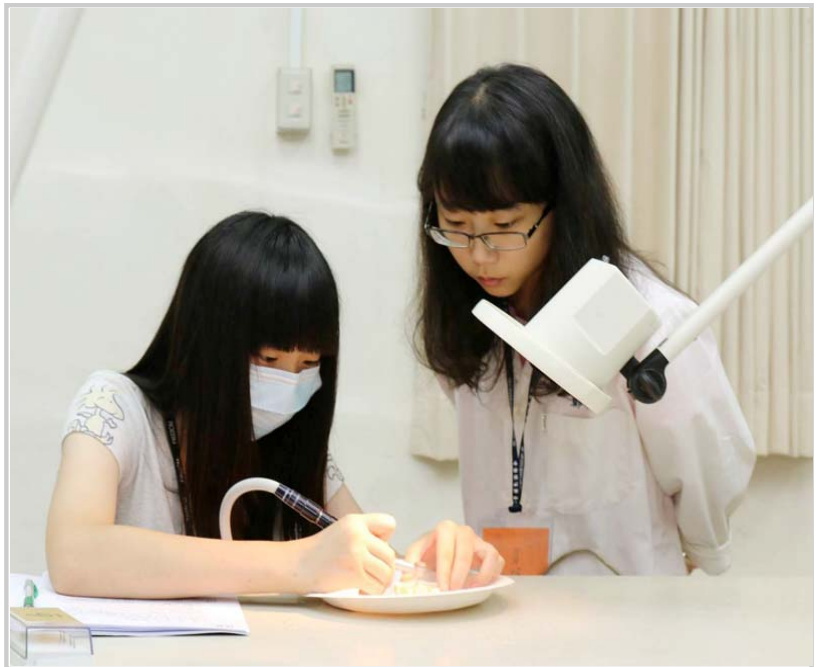
• 小隊員實做蛀牙及補牙的過程