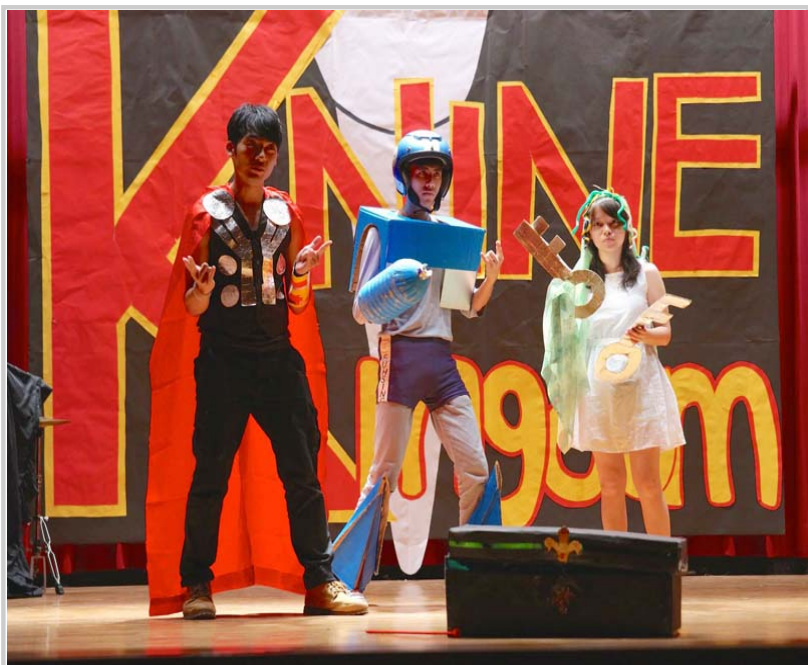
迎新晚會行政劇表演