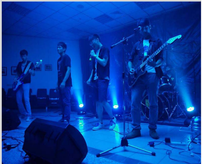
• 舞會—大三樂團K-night 夜騎士