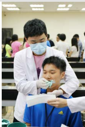
牙材知識跑台—由大三牙醫系學生示範取齒模

「陽明大學第15屆牙醫營」於7月1日至7月7日在本校舉行。舉辦營隊的宗旨在提供高中學生一個瞭解口腔醫學領域的機會，包括牙醫師養成教育的概況、口腔醫學知識以及維護口腔健康的技巧，同時也介紹陽明大學特有的人文氣息與學習環境。讓高中生未來在選擇大學科系及生涯規劃時，多一份參考與認識。今年的牙醫營吸引全國公私立高中約80名學生參與。