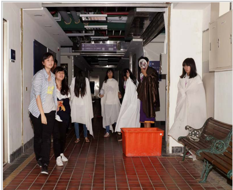
「魅影幢幢」在活動中心B1的關卡，小隊員隨著鋼琴聲走入神秘劇情