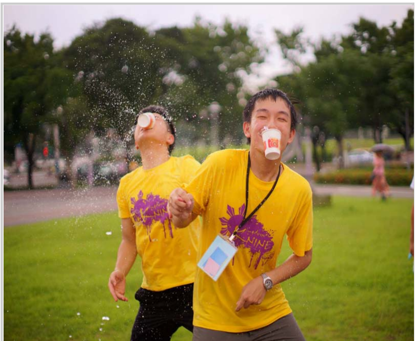
在圓山進行大地遊戲，此關是用杯子把其餘隊員噴的水接起來