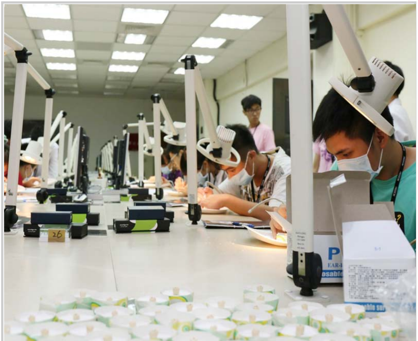
牙體復形學實驗—讓小隊員實際操作機器