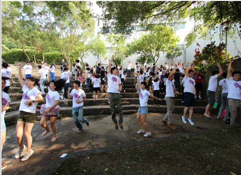
早上來到學校先來跳個早操，喚醒一天的活力