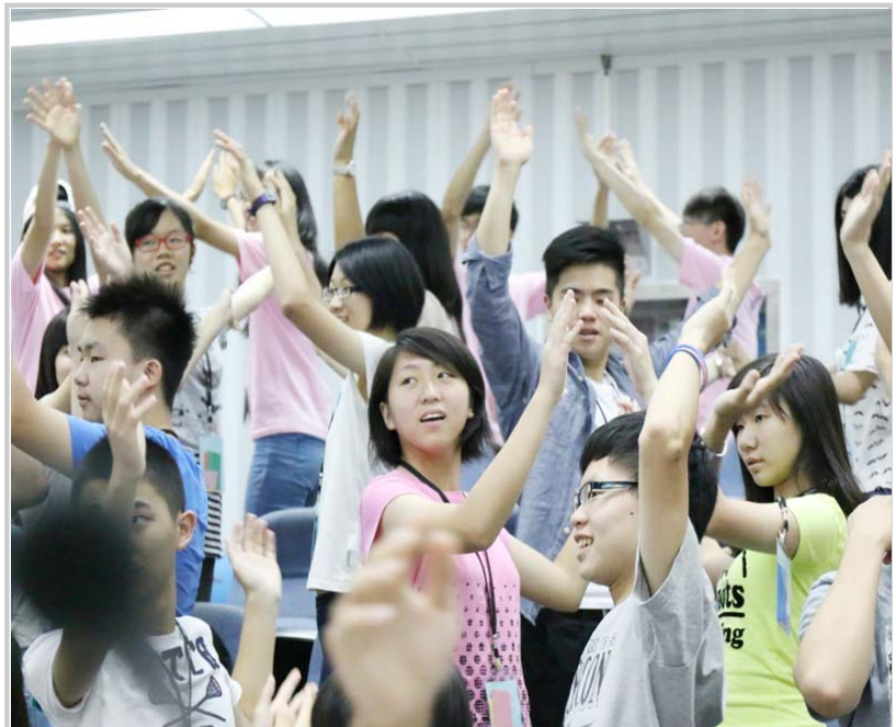
• 課間扭扭(課堂與課堂間一起跳支舞提振精神，避免小隊員打瞌睡)