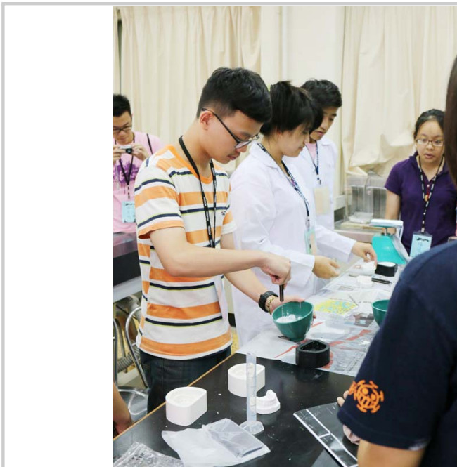
小隊員親手下去灌模