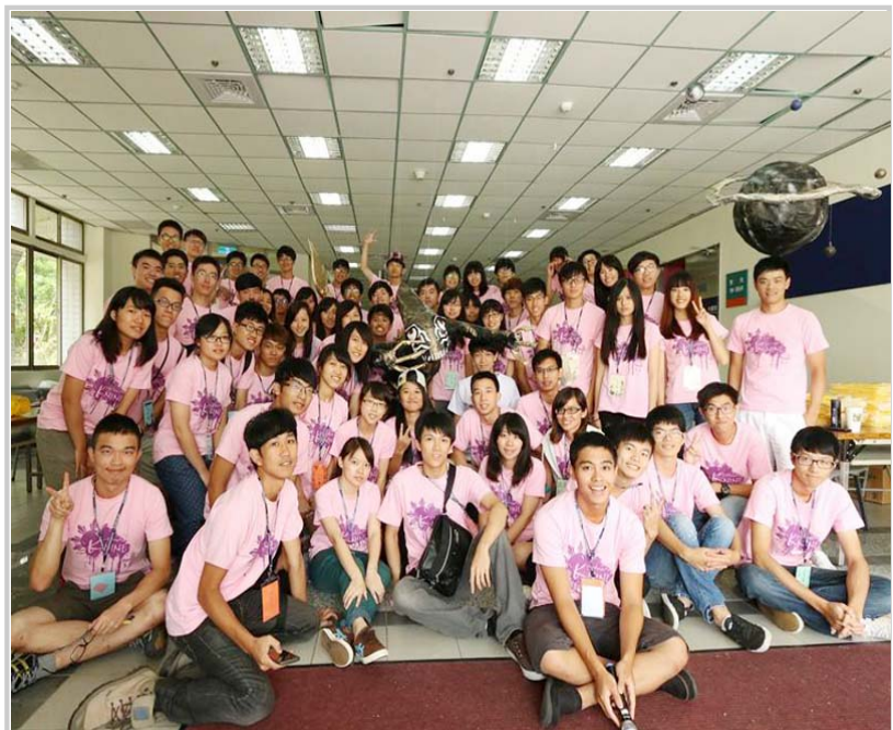
第一天始業式前準備的大合照