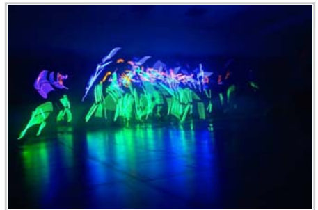
舞會—大二創新的電光舞