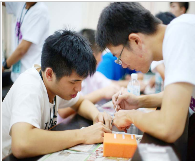
• 刻牙實驗—小隊員體驗刻蠟牙