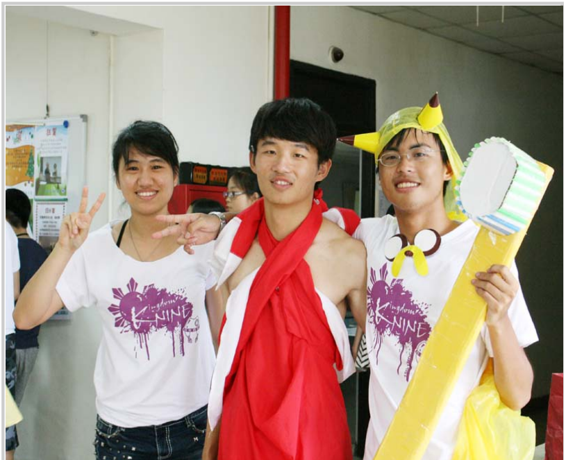
隊輔人員可愛的造型