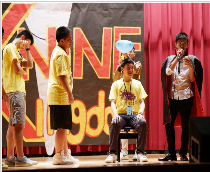
迎新晚會中的小遊戲