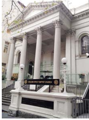
Collins Street Baptist Church 採用新希臘式建築風格

先是買賣雜貨日用品，之後經營旅館酒店，不久就擁有許多旅館，成為當時墨爾本最富有的人之一。他於1848開始為自己建築這間足以顯示他的財富的住宅。如許多有錢人一樣，他將野心轉向政治，1851年後，從市議員、市長，一路進入州政府，做了20多年。第三層是1858年加蓋的。他死後這棟住宅被政府買下保留。曾經為一些政府機關辦公室，1970被RMIT大學使用，2010放棄使用權。現在為一間律師事務所租用。