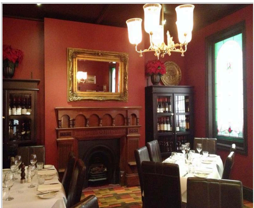
餐廳內部陳設古典