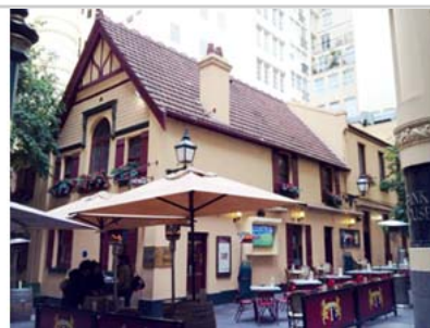
Mitre Tavern是墨爾本最古老的建築，建於1837年

最古老的是Mitre Tavern，大約建於1837年，是風格簡單的私人住宅，建屋者已不可考。1867年後，被改為客棧，1868年所申請的賣酒執照一直沿用至今。早期許多俱樂部的成員在此聚會，像是墨爾本狗俱樂部（Melbourne Dog Club），維多利亞馬球俱樂部（Victorian Polo Club）。此建築位於Bank Place，也就是“銀行街”，距離法院也不遠，因此也是許多達官貴人流連之處。1923被下令加建客房及翻修廚房，但經營者上訴被接受。1930年Royal Insurance Company買下準備拆除改建大樓，1937公司管理階層改變心意，認為其哥德式外觀（Gothic facade）極其代表當時的建築風格，很有歷史價值，決定以原面目保留。現址是一間很受歡迎的餐廳。