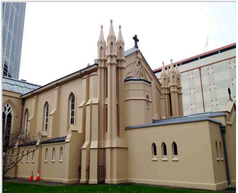
• St Francis' Church是墨爾本第一間天主教堂，也被稱為維多利亞教堂之母