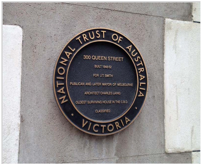
John Smith's House牌匾