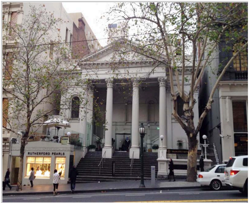
• Collins Street Baptist Church 由建築師Joseph Reed ( 墨爾本市政廳的設計人 ) 重建