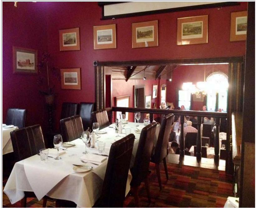
Mitre Tavern現址是一間很受歡迎的餐廳