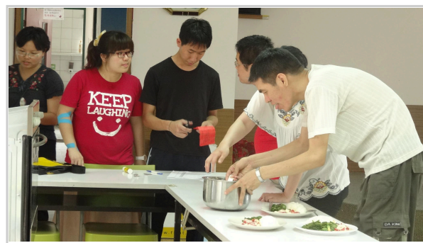
同學和慈芳會員們一起煮午餐

慈芳是台灣五個以會所模式進行的機構之一，會所模式的精神是相信每一個會員都有貢獻付出的可能，共同經營會所，並致力於精神疾病去汙名以及會員們恢復生產力。這個學期，精醫再度來到慈芳，有別於上學期參訪以及帶領活動，這一次我們成為一日會員，體驗會所模式的精神。