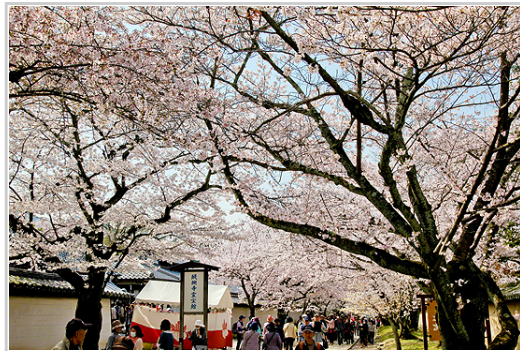
京都櫻花醍醐勸修毘沙門堂上平安神宮二條城

織田信長是不世出的武將，26歲時以3000兵力擊敗當時如日中天國力最盛的東海霸主今川義元四萬大軍，震動全日本。之後二十餘年以「天下布武」統一天下為目標，卻在即將達成前夕，愛將明智光秀叛變，織田信長以48歲之齡死於京都本能寺大火中。