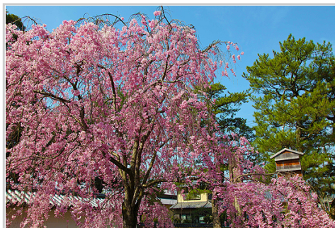
京都櫻花醍醐勸修毘沙門堂儼上平安神宮二條城

每年三月下旬起，上帝之手緩慢輕盈的從日本四島最南方的九州開始，一路往北在兩千多公里的日本山野鄉村城市上逐步有序地塗抹漂染大筆大筆的粉紅或白色，直到五月中旬在北海道嘎然而止。這一個半月的櫻花季節宣告大地甦醒春天來臨，自酷寒中解放的一億日本人心身總動員，愉悅地享受上帝的恩賜，在櫻花樹下靜靜的喝茶或放縱的喝酒。