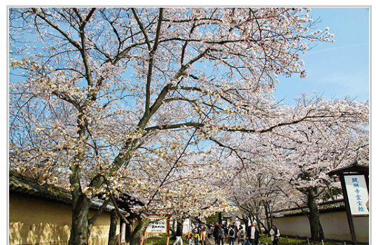
京都櫻花醍醐勸修毘沙門堂儼上平安神宮二條城

千年京都千年花開花落看盡歷史風雲人物，最精彩最驚心動魄的年代，應該是戰國時代（西元1467年起，到1615年德川滅掉豐臣政權的150年間）。百餘年混亂的戰國時代，原來的足利幕府失去控制全國的能力，各地武將集團諸侯大名擁兵自重相互征伐兼併，下剋上父子相殘兄弟互食無日無之。期間出現幾位流傳後代的著名武將諸如武田信玄上杉謙信伊達政宗，但終究都只是地方一霸未能一統日本。直到戰國末期經由織田信長-豐臣秀吉-德川家康三位豪傑之手，方才結束一百五十年的戰亂時代。