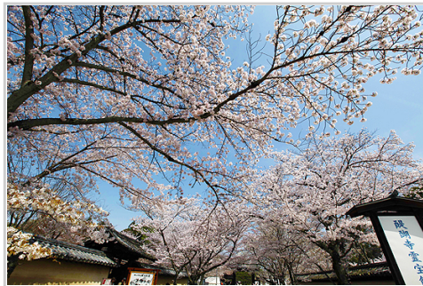
京都櫻花醍醐勸修毘沙門堂上平安神宮二條城

級出身的統治者。父親是尾張國的貧農，17歲時他第一個職位是織田信長的家僕「草履取」，上陣時幫信長提草鞋的。秀吉長得其貌不揚，被稱為「猿」「禿鼠」，但他真有極大的天才，從家僕成為家臣再成為重要的武將。1582年本能寺事變發生時，秀吉正在離京都200公里的備中高松城與毛利軍作戰，第二天深夜他得知消息，旋即用兩天時間誘使毛利軍議和，然後率領兩萬五千大軍狂奔疾行，七天之後出現在毫無頭緒的明智光秀前，為織田報仇也奠定豐臣時代的來臨，日本史稱此次疾行軍為「中國大返還」（備中高松所在地日本慣稱中國）。