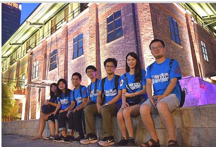
參加這次夏令營，是個前所未有的體驗

參加這次夏令營，有別於以往出國的經驗，不像單純的旅遊團只是吃吃喝喝、走走看看，也不像之前的國際志工只有局限於某一地區的交流。來到上海，看到來自台灣各地的大學生以及上海交大的朋友們，我就知道這次將會是個前所未有的體驗。