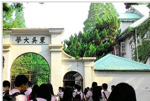
參觀東吳大學的前身「蘇州大學」

前往杭州的路程蠻久的，到達的時候已經過了大半天，首先去了「夢想孵化城」，是個剛蓋好不久的產業發展中心，裡面都是由某些特定的小組構思點子，涵蓋各個領域，只要夠有發展性，這個中心便會提供資金。晚上到西湖附近的「河坊街」邊逛邊吃，裡面的東西其實都大同小異，不過佔地真