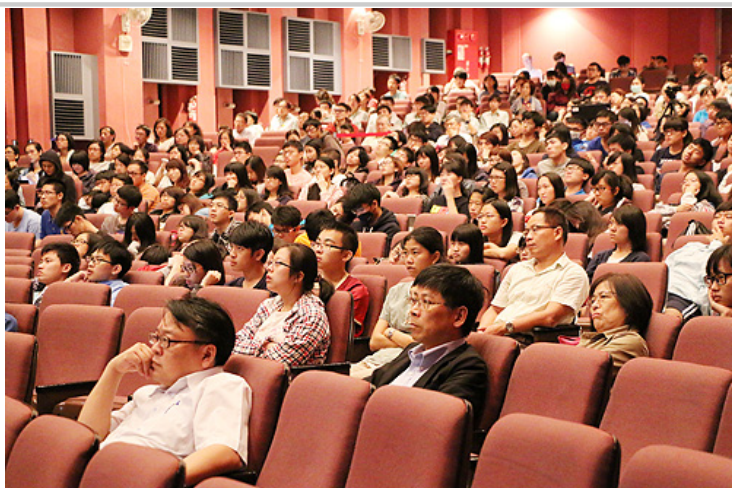
黃院長精采的演講，為大家上了一堂感人且深富啟發的生死學課