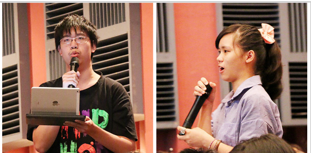
黃院長知性又感性的分享，引起同學們的熱烈迴響，紛紛就相關議題提問

「所以，大家可以勇敢地去面對，死亡並沒有那麼可怕！」黃院長最後做結論說：「而且，在死亡的過程裡面，不管你是親人或醫療團隊，都會學到更多東西，有更多成長；而在這樣的良性循環下，社會也將更好、更和諧！」