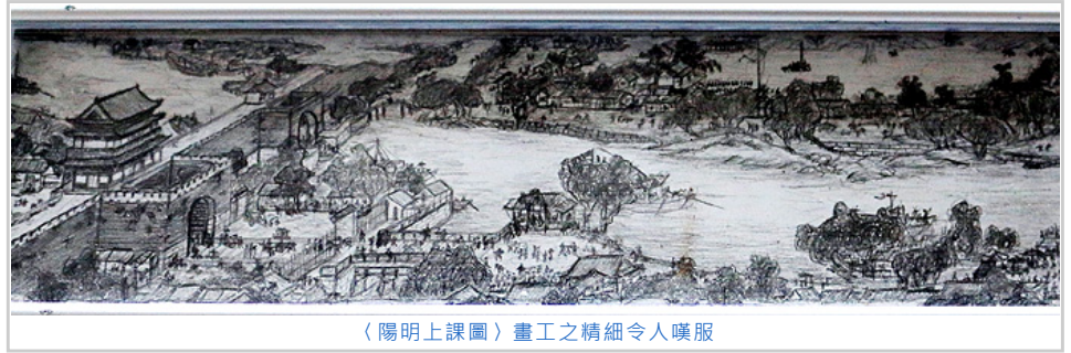
〈陽明上課圖〉畫工之精細令人嘆服

PS.本來預計是一學期完工，下學期要來畫〈淡水河圖〉（從學校山坡上看出去，風景真的很不錯）。但是前者進度像政府工程不斷延宕，所以後者就沒有實行了。