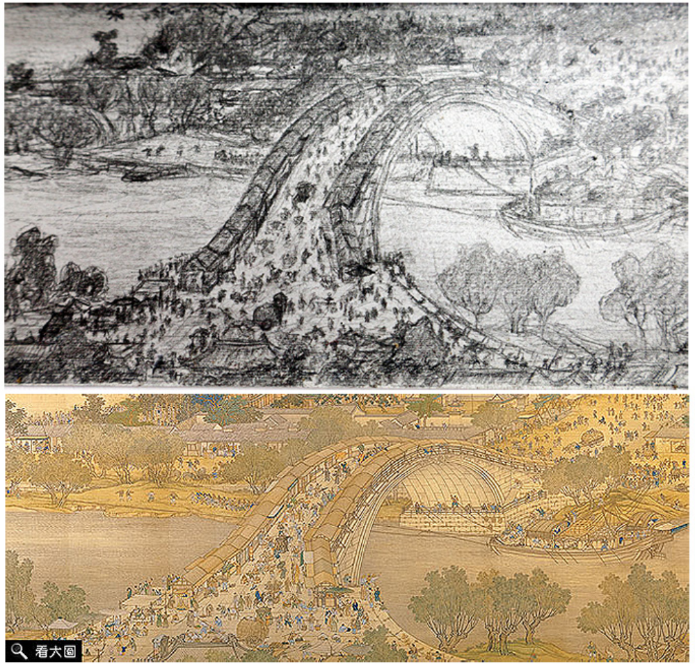
〈陽明上課圖〉（上）與〈清明上河圖〉清院本（下）對照

據了解，校方已在研議如何保存這幅作品，讓大家可以繼續欣賞。至於大家對這幅畫的諸多疑問，由於作者不願曝光，本報特以書面訪談的方式，讓作者一一解答，也讓大家能更了解這幅畫的創作理念與歷程。