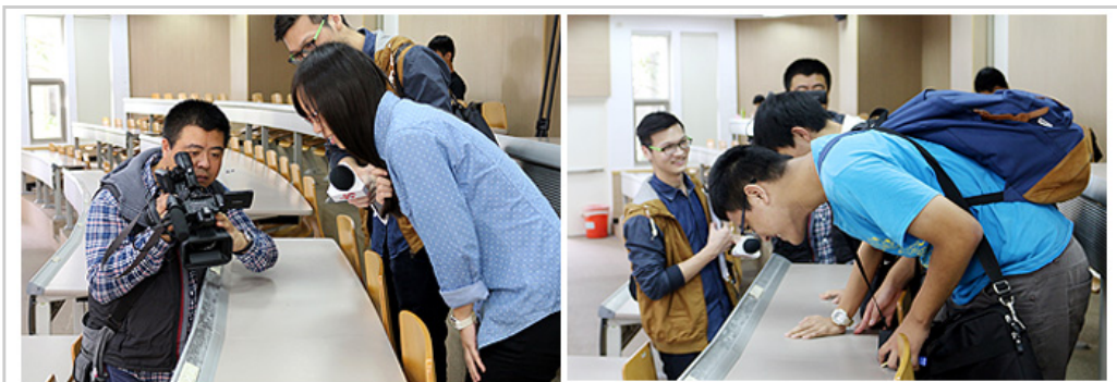
各大媒體紛紛來到陽明校園拍攝、採訪