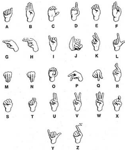
每個國家都有不一樣的手語。