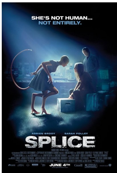
人工進化宣傳海報

在日新月異的今日，複製羊或是異形對我們來說早已不是新鮮的話題，但你聽過有一種生物，牠結合了來自八個不同生命的基因嗎？今年七月底在台上映的《人工進化》，在播出之前已在網路新聞，和各大電影討論區引起一陣廣泛的迴響。