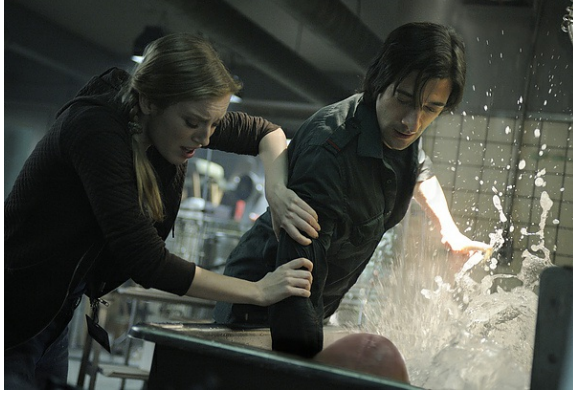
男主角基於科學倫理想殺死卓恩，卻意外發現她擁有雙棲動物的肺。

艾兒莎把卓恩看成自己的女兒一般扶養，卻又因為自己小時候遭受母親家暴而對卓恩反覆無常，時而讚美她異常聰明；時而對她大吼大叫。卓恩體內擁有多種動物的基因，但她既不能像一般的野獸在戶外自由走動，更不可能擁有人類受教育的權利，她像小鳥一樣被囚禁在實驗室，從來沒有屬於自己的自由。這個伏筆讓我們明顯地察覺到，這樣的故事無庸置疑，將會以悲劇收場。