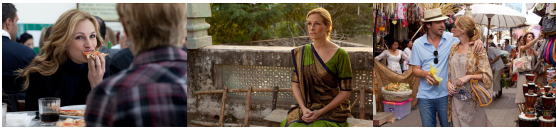
享受生活的羅馬，沉澱自我的印度，尋獲真愛的峇里島。

的每一個人當成老師，從檢視到發現自我，最後接受自己的全部，也找到了值得去愛的人。