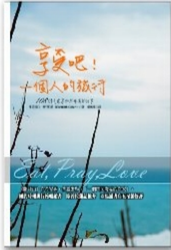
電影原著由伊莉莎白吉兒伯特依親身體驗撰寫而成， 由108則享樂與平衡的故事組成，連續蟬聯17周暢銷冠軍。

與其它改編電影一樣，《享受吧！一個人的旅程》也難逃被拿來與原著比較的命運，要將一年的故事、主角情緒轉變皆完整呈現在大銀幕上並非易事，濃縮成140分鐘的電影後，難以細膩刻劃主角微妙的心情轉變，主角在旅途中發生的每一件事都是帶來下一個轉變的契機，但從文字轉化成畫面時卻顯得有點囫圇吞棗，讓人難以消化，這也顯示出了改編電影一直以來的難處，在片長限制下，少了些文字的深刻與能帶來的想像空間。