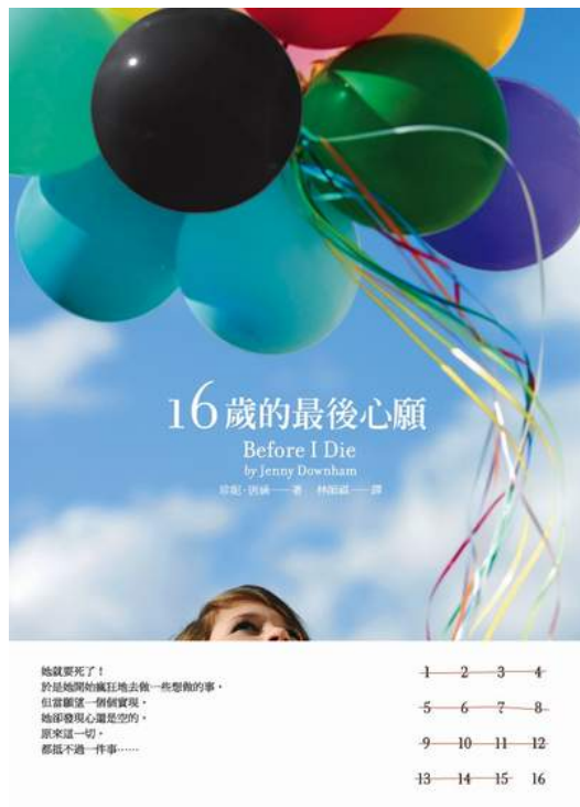
小說《16歲的最後心願》是珍妮·唐涵的處女作，描寫著一個罹患白血病女孩的故事。輕鬆好讀的文字，及內容展現出對於生命意義的探索，是獲得外界好評的青少年讀物。