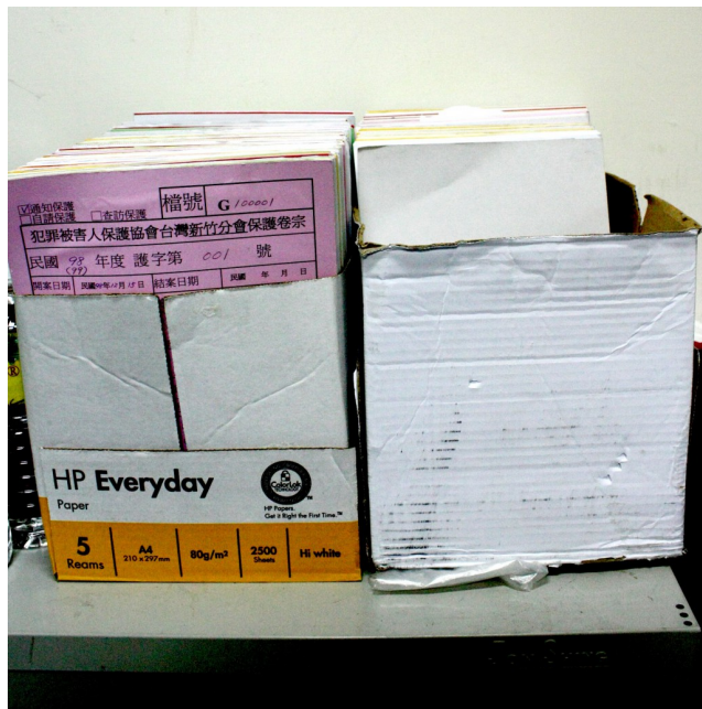
冰冷的案件外表，裡頭盡是一則則血淚故事。