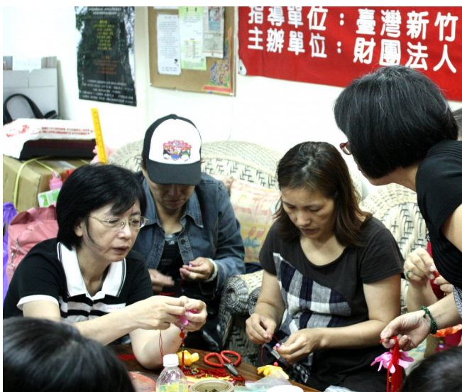
期望溫暖和熱情能打開眉頭的枷鎖。