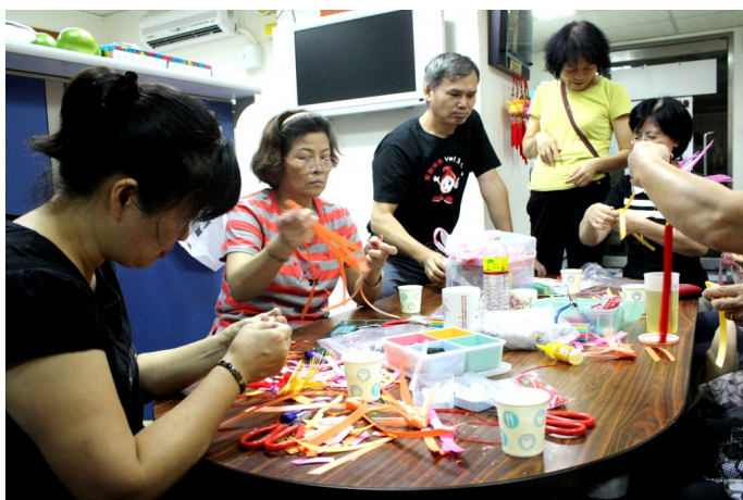
這天他們要利用自己所學回饋社會，幫助他人。