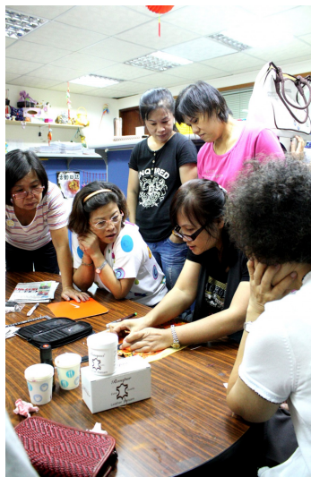
這些人，都有不為人知的故事以及不願多談的祕密， 在專業老師的教導，以及團體中相互慰藉、鼓勵， 他們拋開傷痛，投入於編織工藝。