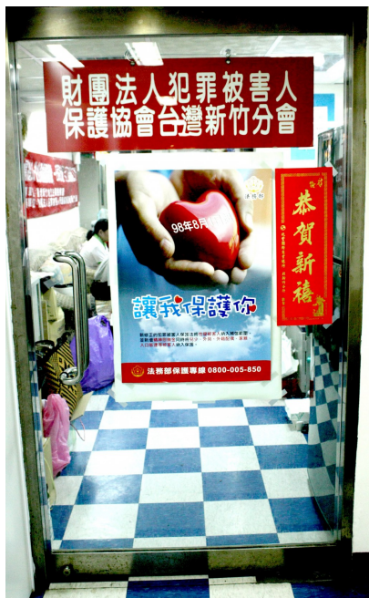
隱藏在市區高樓中默默佇立的一扇門，推開它，讓許多人看見了希望。

新竹市犯罪被害人保護協會，開設手工編織課程，讓保護人學得一技之長，找到解決經濟困難的方法，在團體中也得以抒發情感、尋求協助。透過藝術，不但達到心理輔導的作用，也讓被害人走出陰霾，甚至能夠轉而協助他人，從中獲得意義和滿足。