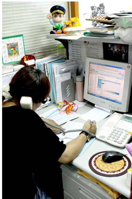
協會的工作人員每天都有忙不完的事， 針對各種不同的案子，給予不同協助。