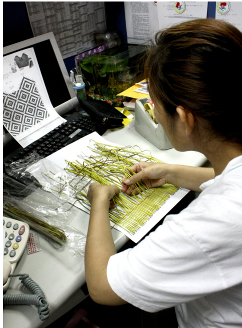
一步步小心翼翼，專心是必要條件。