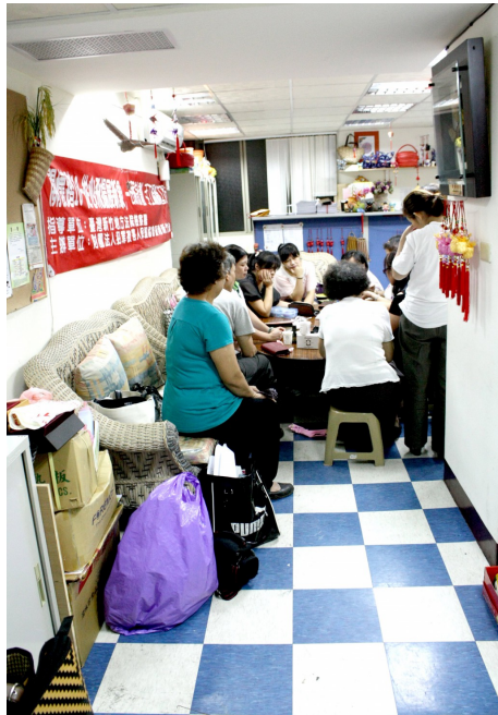
走進去是一個狹小但明亮的空間，眼前的一群人， 是誰？在做些什麼？