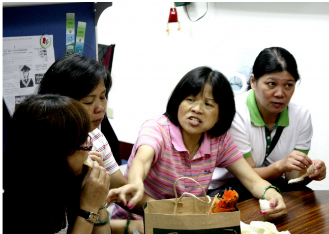
週二晚上的課程結束後，討論著接下來的重要任務。