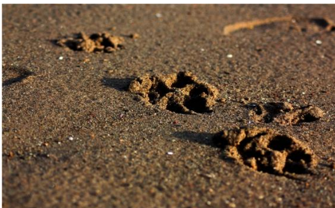
我的幸福未來要靠著自己一步步地去實現。

話說我才說到這裡，遠遠地又看見那隻有著無辜雙眼，和超喜歡黏著人褲腳撒嬌的臭小狗跑了過來。我懶懶的撐起趴了一整天身體，抬起前腳把牠再度踹得遠遠地。牠舔舔爪子，在媽咪和爸爸看過來的時候，裝出比小小狗還可愛的無辜眼神，嗯哼，想和大爺我爭寵也不想自己的地位。俗話說長幼有序，先到者先贏，想和我比心機還早的很，如果不是我沒注意被發現，在那一隻老人相的臭狗碗裡尿尿的事情也不會那麼早就被揭發出來，而且比起你們，平常我都乖多了，家裡常常會來許多客人，那種見怪不怪的事情你們這些小蘿蔔頭只會扯開喉嚨開始吠，真是沒有常識，也不多多向大爺我學學。欸這事多說無益了，看見遠遠的媽媽拿著一碗骨頭來，我這就要去爭取自個兒的幸福未來，日後再會。