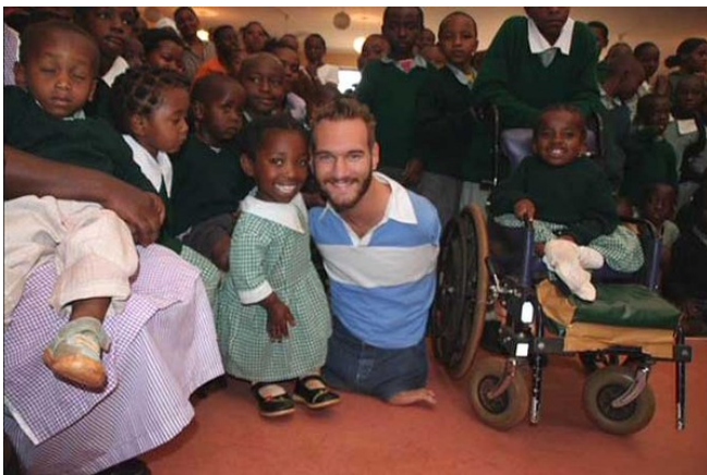
力克常常到世界各地演講，努力散播希望與愛。

十六歲時，力克因緣際會下在一次的小型聚會中，跟同學分享了自己的故事，意外地獲得好評，力克便決定以「激勵他人」為生命目標，因為他相信上帝選擇了他，要他用自己的故事道出上帝的意旨。在創辦非營利組織——「沒有四肢的人生」後，力克笑稱自己是台「擁抱機器」，至今已在超過二十五個國家舉辦過一千五百多場演講，給予並接受數百萬個擁抱。力克除了常常在各國最大的場地如體育館、鬥牛場、表演廳或巨蛋舉辦演講會之外，也不斷造訪教會、學校、垃圾城、貧民窟、勒戒中心、監獄和紅燈區。他努力散播希望與愛的行動便是《人生不設限——我那好得不像話的生命體驗》一書的雛形。