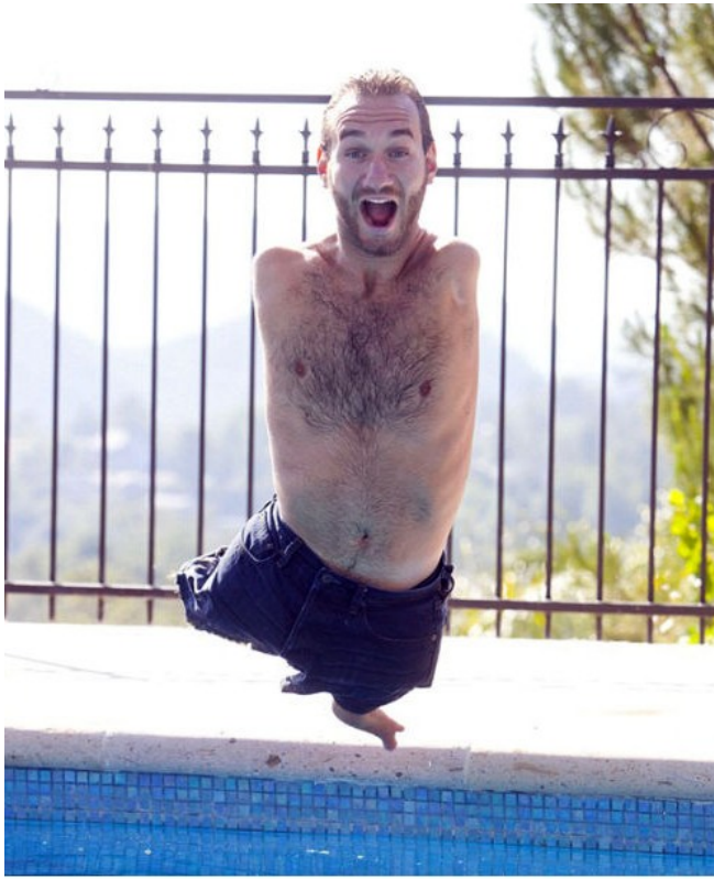
雖然沒有手沒有腳，力克還是活出了沒有限制的人生。

十六歲時，力克因緣際會下在一次的小型聚會中，跟同學分享了自己的故事，意外地獲得好評，力克便決定以「激勵他人」為生命目標，因為他相信上帝選擇了他，要他用自己的故事道出上帝的意旨。在創辦非營利組織——「沒有四肢的人生」後，力克笑稱自己是台「擁抱機器」，至今已在超過二十五個國家舉辦過一千五百多場演講，給予並接受數百萬個擁抱。力克除了常常在各國最大的場地如體育館、鬥牛場、表演廳或巨蛋舉辦演講會之外，也不斷造訪教會、學校、垃圾城、貧民窟、勒戒中心、監獄和紅燈區。他努力散播希望與愛的行動便是《人生不設限——我那好得不像話的生命體驗》一書的雛形。