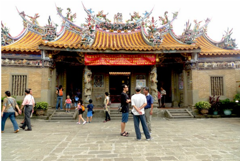
北埔慈天宮，乘載了北埔的歷史，更乘載了北埔人們的信仰。