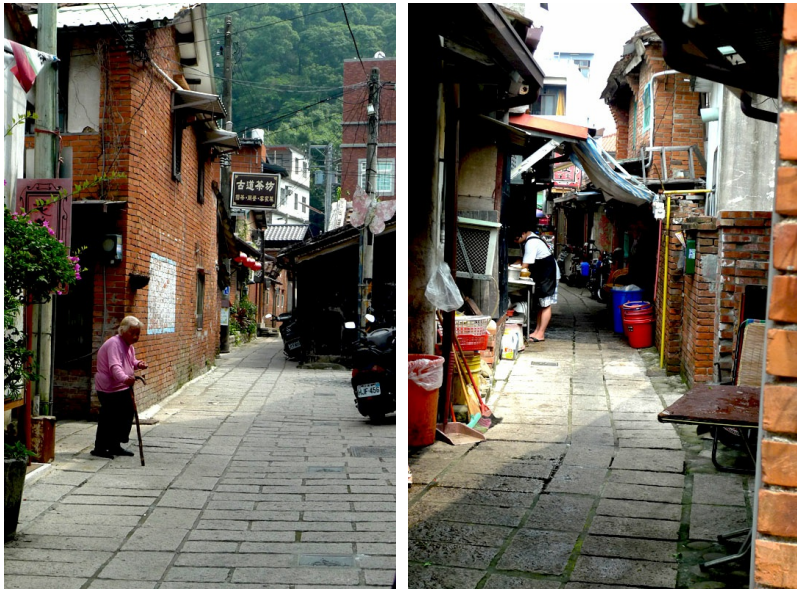
北埔的老街與老人，以及巷弄內的生活。老阿嬤的身影與老街相呼應，雖然她的身影是多麼地孤獨，但卻也是北埔古色古香的生活風味。而戶與戶之間是如此狹小，卻也是連結北埔居民彼此的最大功臣。