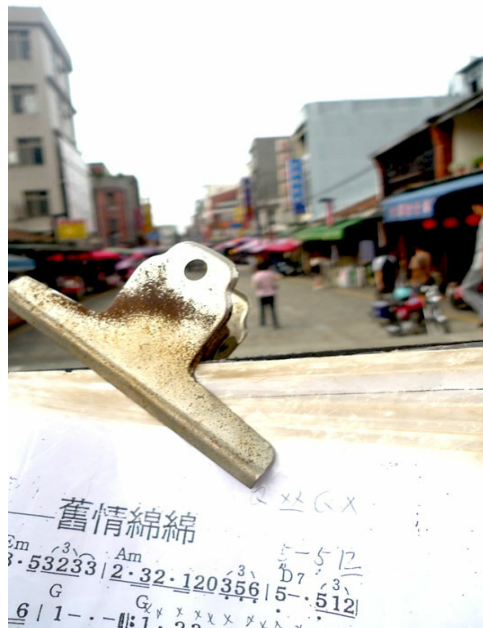
舊情綿綿，北埔人和遊客們都對北埔留了許多情。