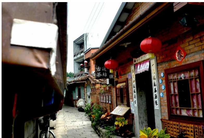
巷弄間不只是普通的民房而已，可以在裡面喝口茶，體驗北埔的客家風味與熱情，這也是為何許多遊客會來北埔的原因。