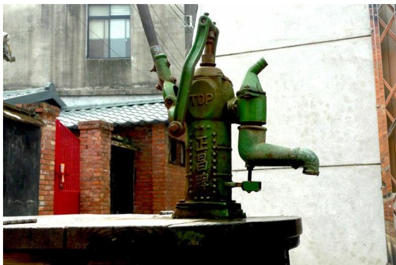
坐落在北埔巷弄間的水井，為這客庄更添古意。