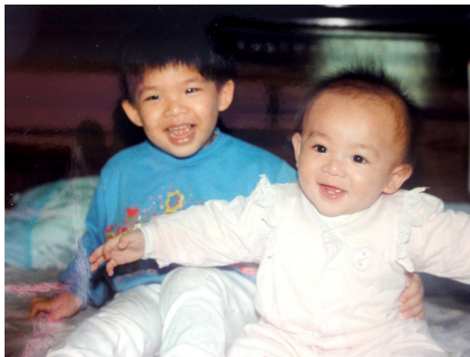
姐弟倆小時候的可愛模樣。

曾經過著獨生女的日子，每天被家人抱在懷中，不用付出什麼就可以得到許多的關心和疼愛。看著媽媽的肚子越來越大，開始不斷被灌輸裡頭裝的是未來的弟弟，以後要照顧他，當個好姐姐。在出生後的一年又253天，家裡多了一個人，是個白白胖胖的男寶寶，從小就是一個會討長輩歡心，貼心又可愛的小孩，大大的眼睛、可掬的笑容，舉手投足都是注目的焦點。再加上爺爺奶奶傳統的觀念，雖然表面上是公平對待，但常常在無意間的一句話或是一個動作表示出對弟弟特別的關愛，做姐姐的在一旁看在眼底特別刺眼。