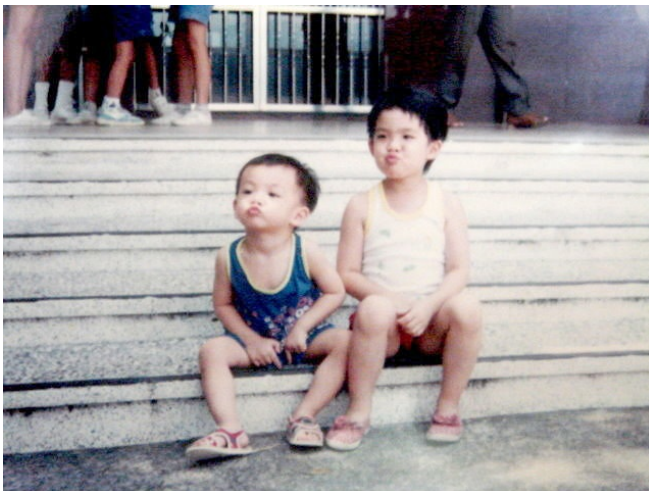
小兩歲的弟弟總愛模仿姐姐。

小時候的他總是跟上跟下，姐姐有的他都要有，玩在一起最後一定是翻臉收場，不知為了搶玩具和不服遊戲結果而大打出手多少次。小學時，有一回是熱水VS電蚊拍，那時候的心態也只是純粹將道具作自我防衛使用，誰知突然哪根筋不對，失去理智而進入了攻擊模式，幸好兄弟間雖然沒什麼手足之情但還存在著人性。往往激烈的鬥爭過後，隔了幾小時又是一片嬉鬧的美好光景。