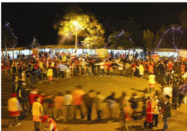
眾人通宵達旦跳著整齊的舞步，唱著肅穆的祭歌，漩渦狀的隊形是對當時事件發生的追悼。

因為「矮靈祭」是基於對矮人懺悔所舉行的祭典，所以整個儀式是神聖敬畏的，儀式的舞步沒有花俏的動作，主要是強調整體性的踏步，徹夜的歌舞維持著漩渦狀的隊形，其中漩渦狀的隊形是重現當時矮人墜入河谷的意象。