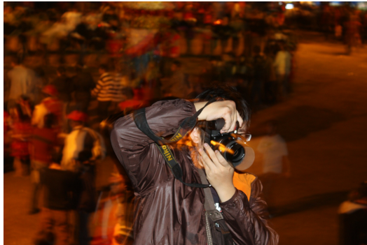
手持相機捕捉珍貴畫面的遊客，在矮靈祭祭典中十分突兀。（攝影／陳文玲）

除了一般從山下特別開車上來的遊客，亦有住在五峰鄉附近的泰雅族人。自己曾在九族文化村從事原住民舞蹈表演的阿妹興奮地說：「我自己也有跳過矮靈祭的舞，現在可以看到完整版的，來這就像是朝聖一樣！我們表演的時候，只有跳迎靈的部分，畢竟還是要尊重他們，矮靈祭的舞不是誰都能跳！」從她口中聽到她對於「矮靈祭」的尊重。