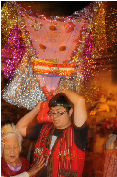
賽夏族人身上的臀鈴隨著身體擺動而發出清脆的聲響，壯年男子扛著寫有家族姓氏的肩旗，「娛靈」活動一整夜都不能停歇。

「娛靈」是開放遊客參與的活動，遊客須先到祭堂繫上芒草，以保平安。賽夏族人穿上大紅條紋的傳統服飾，背著一幅臀鈴，隨著身體搖擺，臀鈴發出清脆的響聲，唱頌當年矮靈長老留下來的祭歌，並由男性扛肩旗，眾人手牽手，踏著整齊的步伐，維持漩渦狀的隊形，通宵達旦地持續娛靈舞蹈和唱頌祭歌。