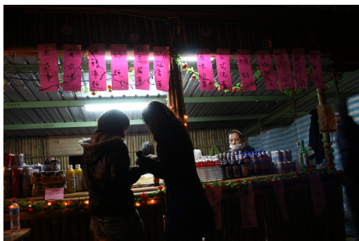
圍祭場周的擺攤，為賽夏族人帶來觀光收入，讓人感到濃厚的商業化氣息。

遊客所帶來的眾多問題，使得開放給遊客參與祭典不免備受爭議，但由於現今政府一再強調文化創意產業，用文化創造財富，讓它成為一種有價值的商品。政府是促使「矮靈祭」成為觀光點的推手，在手冊、海報上看到主辦單位是新竹縣五峰鄉公所，賽夏族人以新竹縣五峰鄉文化藝術協會的身分露臉，掛的頭銜只是承辦單位。政府出錢讓「矮靈祭」變成一種文化產業，手冊上自然標上相關公家機關為主辦單位或是協辦單位。