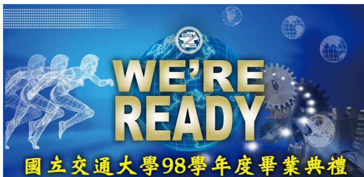
畢業後進入職場或升上研究所，但，真的都準備好了嗎？

隨著近年來大專院校的增設和改制，學校的數目在二十年內從 123 間增為 163 間，而因教育改革新增的入學管道，如八十三年度的「推甄入學」和八十七年再闢的「申請入學」，讓大學院校新生錄取率自八十八學年度的 59.83%，在短短十年內飆高至去年的 97.14%。如此高的錄取率使得擁有大學畢業證書的社會新鮮人不再像從前一樣得天獨厚，備受矚目。於是，大學畢業後繼續攻讀研究所，便成為青年學子儲備競爭力，進而期望鶴立雞群的普遍現象。