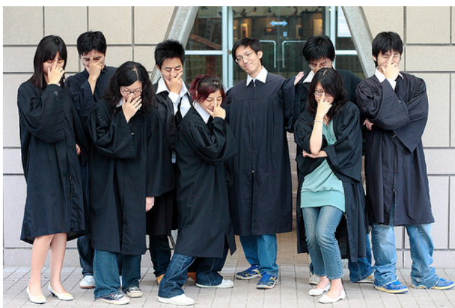
台灣年輕人不能只有創意，還要有實力，攻讀研究所必須對症下藥。

受到社會經濟環境以及生涯規劃的影響，大學部學生的延修情況也逐漸增加，光九十八學年總計就有 3.9 萬位延修生。延修和休、退學的現象或許是學生對於沒能選上符合志趣科系的一種反抗手法，另一方面，這也解釋了學生申請研究所風潮的其中一項成因。不少人爭取大學學歷的原因只是為了要給父母一個交代，以及考慮到未來找工作要求的學歷考量，等到大學畢業後才選擇喜愛的藝術或者文學等相關系所，作為對自己的補償。無論背後的原因為何，協助年輕人如何盡早發掘志向並發揮所長，不僅攸關著台灣的前途，更是社會所需關切的重要議題。