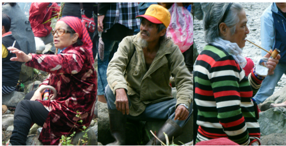
老人家在一旁閒聊，叼著菸斗看子女忙碌。