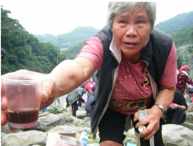
「沒喝過保力達吧，啲，喝一杯啊」。