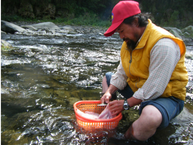
趙大哥邊切豬肉邊說：「這隻豬大概有兩百斤！」