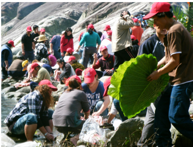
大人們在河邊忙進忙出，準備食物。