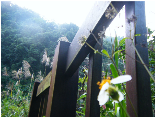
河邊綠意盎然，木頭欄杆圍住步道，指引到河床祭典的方向。

矮靈祭的最後一項活動——送靈，在河邊，賽夏族人們喝酒跳舞狂歡。老人家們看著子女忙碌，閒聊抽著菸斗。大人在河邊煮食，河床就是廚房，河流是水龍頭。大狗興奮地叼起大骨頭滿足的逃走，小孩異常安靜。小米酒一定得喝完，各式各樣的容器都有，沒有人清醒著。每個家族圍成一個圈，聚在一起吃飯，祭典是家族的大事，也是家人的團聚。