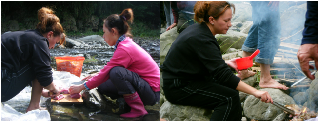
河床就是廚房。