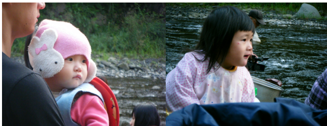
小朋友安靜的看著這一切，河流與人群、酒精、瘋狂的大人。