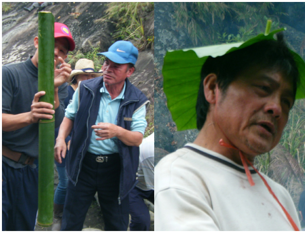
「小米酒一定要喝完。」長長的麻竹，中間的節被打通裝滿酒，一個小刻度就是一大口。 大叔喝醉了，戴起姑娘芋的葉子當帽子，到處灌別人酒。