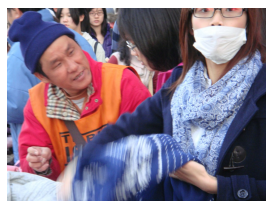
賣雜誌之餘，他也不忘照顧其他的街頭販售者，