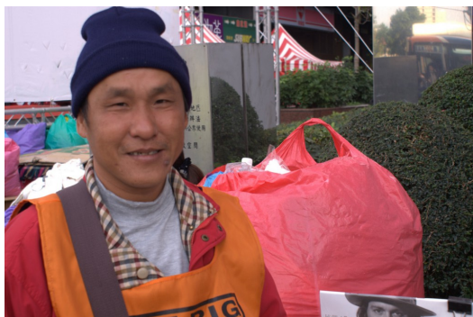
不同於一般銷售員的單調叫賣，他積極地向路人介紹大誌，「不政治，不八卦」是他想到的口號。