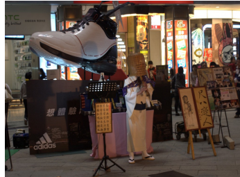
西門町販售點，街頭藝人與商圈吸引了大量人潮， 卻是雜誌生意最清淡的地方。