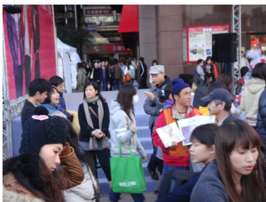
台北街頭橘背心，是大誌街頭販售員的標誌。