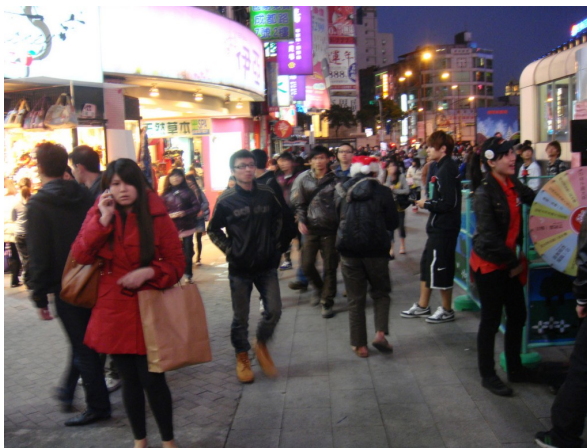
聖誕節將至，販售員像其他的販售員一樣， 戴上了應景的聖誕帽離開了，幸好他還有件大衣。

在台灣，《大誌》由大智文創雜誌社引進，開放網路訂購。目前在九家主要贊助單位中，僅聯合勸募為非營利組織。街友定期開會培訓，但除了一開始作為本錢的十本雜誌和每賣一本賺的五十塊以外，什麼都沒有。