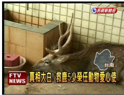
從野狗的利牙救回，卻也只能救回囚籠裡。

事實上，歸仁國中已有梅花鹿被野狗咬死的先例，其補救辦法是加裝鐵網，並添購更多梅花鹿，才會醞釀這次事件的發生。狗善於掘洞，且對鹿有天生的敵意，而梅花鹿是非常膽小、神經質的動物，且需要大範圍活動和躲藏空間，觀察歸仁國中倖存梅花鹿的照片，可以從脫毛和萎靡情況清楚得知，牠們的精神狀況並不好，應是長期被學生的吵雜聲和野狗所驚嚇。這樣的「生命教育」，究竟教育了學生什麼呢？