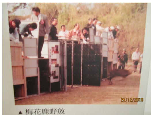
奔向自由的一刻。

台灣梅花鹿在1974年就被國際自然生態保育聯盟列為「全球最受威脅鹿種」，並施壓希望能保育，但直到1984年，國家才撥出經費，讓墾丁國家公園執行復育。但在發佈警訊的內，梅花鹿已經滅絕，墾丁最初的梅花鹿來自木柵動物園的20頭，由於基因庫單調，導致梅花鹿的生理問題特別多，但復育的黃金時間已逝，如今只能盡事後的努力。