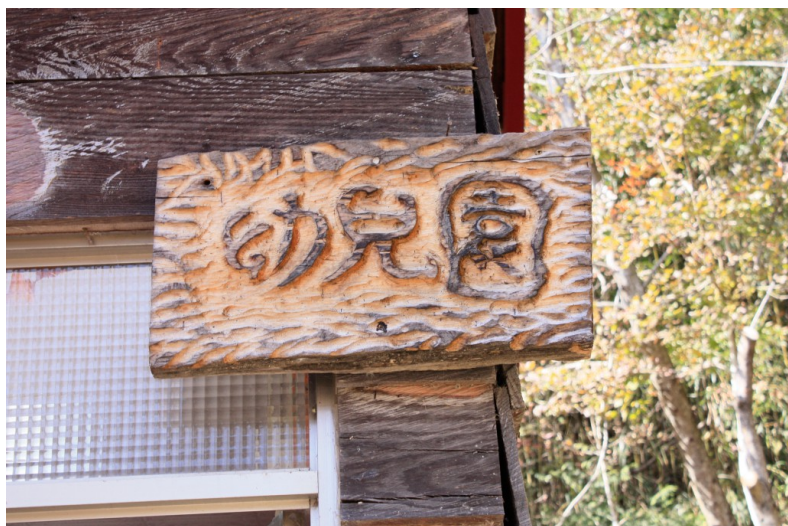
司馬庫斯有自己的幼兒園，裡面有著大大小小不同的學生。給予人們一種社區的感覺。