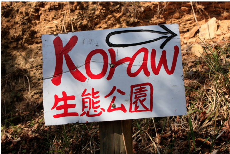
司馬庫斯的生態公園開放參觀，向前走就對了！