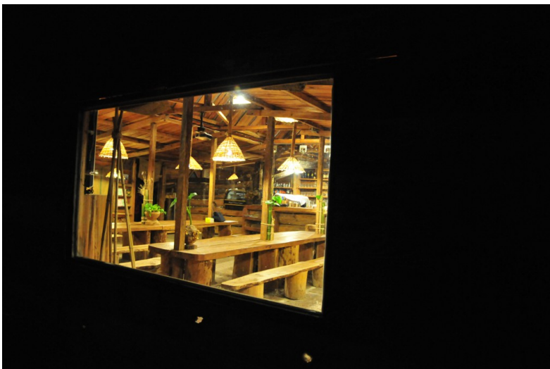
晚上的司馬庫斯，在酷寒的天氣裡，透過窗戶觀看到溫暖的小房子。