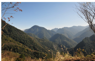
位在高海拔的司馬庫斯的空氣很清新，環境也很清幽，因為它是一個無菸的社區。