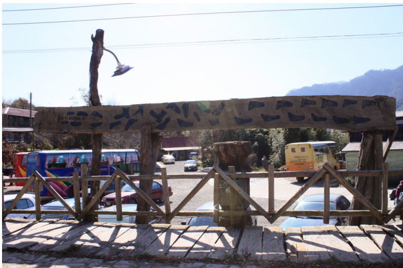
這裡是一個可供觀光旅遊的原住民部落——司馬庫斯。