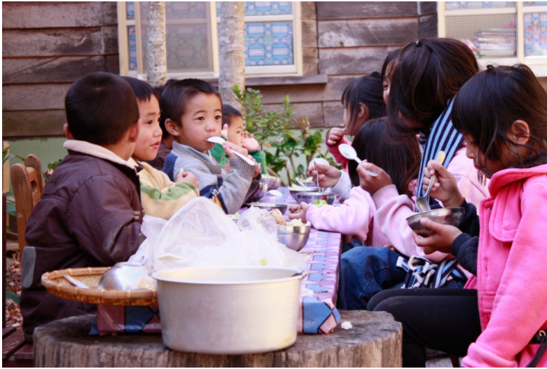
小孩子滿足的表情，可以感受到他們非常珍惜他們簡單的午餐。 還待在司馬庫斯的年輕人，大概就只有年紀這麼小的孩子。