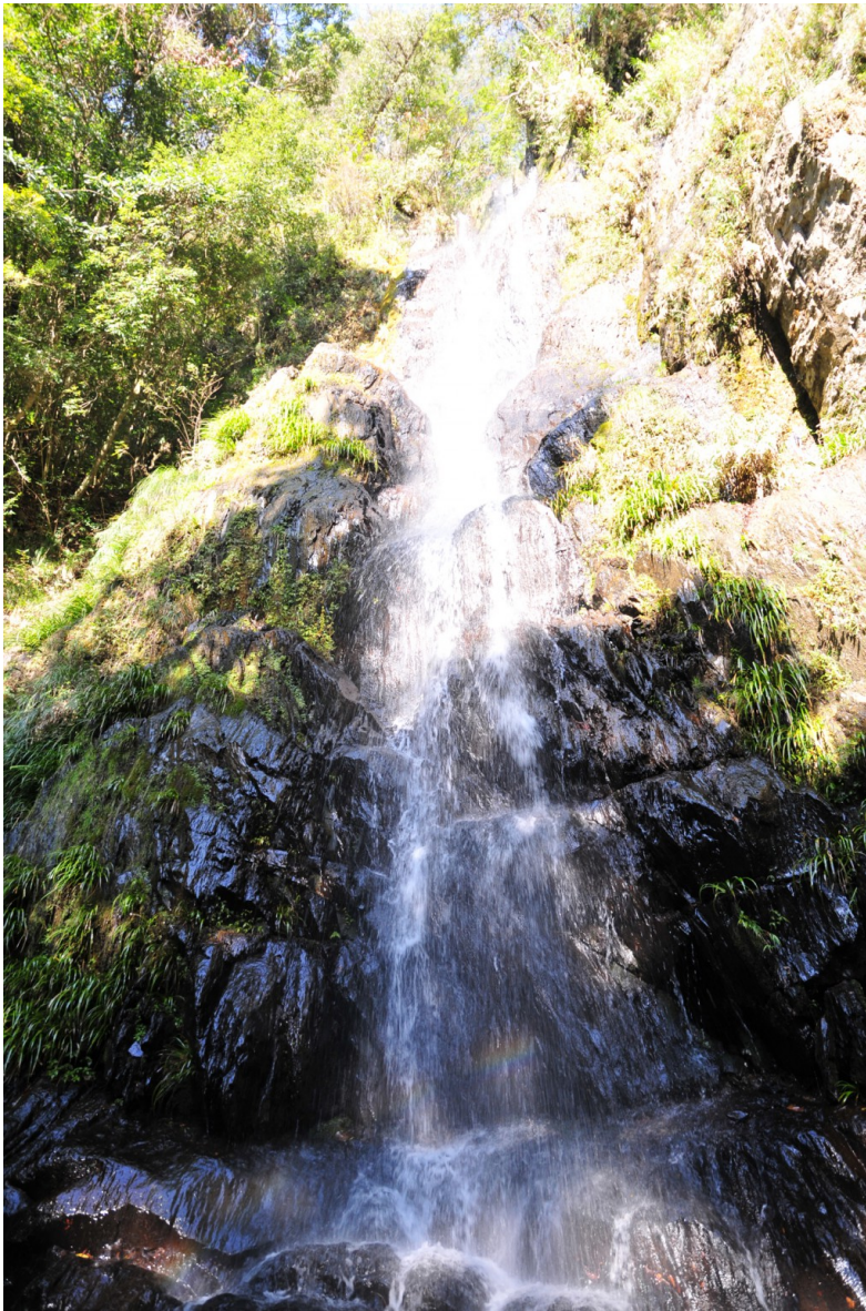
瀑布氣勢磅礴，在潺潺流水聲之間還可以看到彩虹。 這條澄清透明的瀑布，不知道還可以流洩多少年？