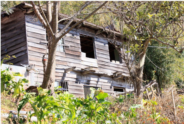
這個荒廢的木屋，已經沒有人住在裡面。原本的屋主去了哪裡？（攝影／林嘉敏）