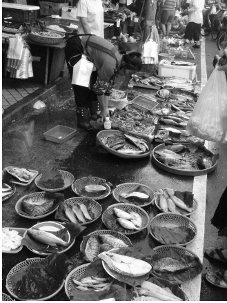
你只知道Jasons Super Market、City Super，和Cosco嗎？事實上，道地傳統的沿街擺攤，才是家庭主婦在台北的好去處。