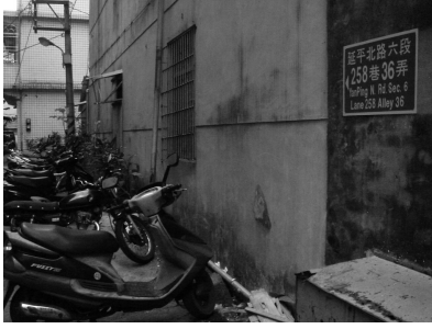
充滿污漬的牆面，恣意停放的車輛，「延平北路六段」是離士林鬧區不到十分鐘車程的距離。