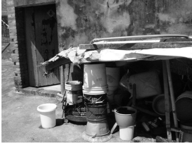
水桶任性的堆疊，躲在不起眼的一隅。誰說台北一定井然有序？