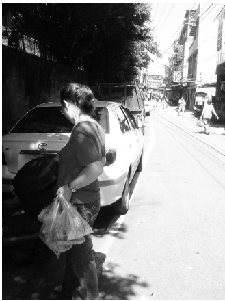
滿手的提袋是逛完傳統市場一周的戰利品，更是家庭主婦滿足「大口」、「小口」的簡單幸福。