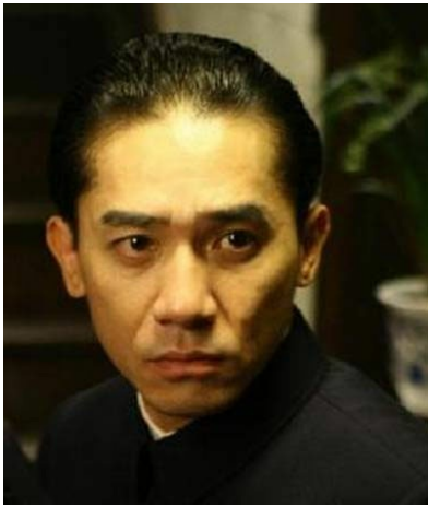
張愛玲描述易先生有幾分鼠相，梁朝偉為此拔去髮尖頭髮。