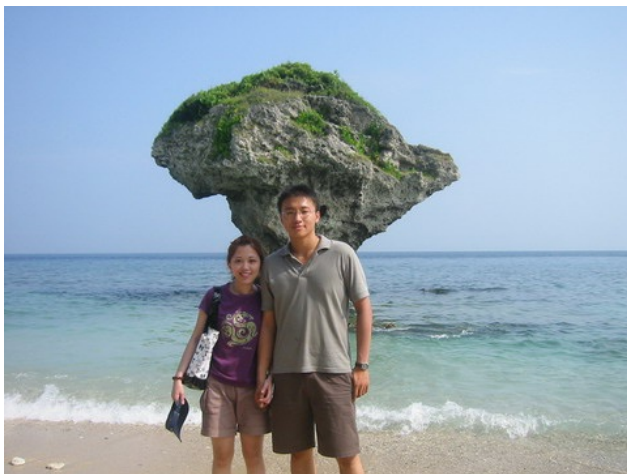
臺灣人旅行通常只前往著名景點留影,卻很少深入當地生活

台灣自民國六十八年開放出國觀光,每年出國人數成長快速,到了民國九十五年,已接經進六百萬。台灣從前賺錢淹腳目,出國消費闊綽,受到各國的歡迎,相傳過去台灣人到瑞士買名表,商家習慣將來店消費第一高的國旗高高掛起,愛國心切的台灣人每每看到自己的藍天白旗滑落,就加緊消費,讓中華民國的國旗能在別人的國土上飄揚。