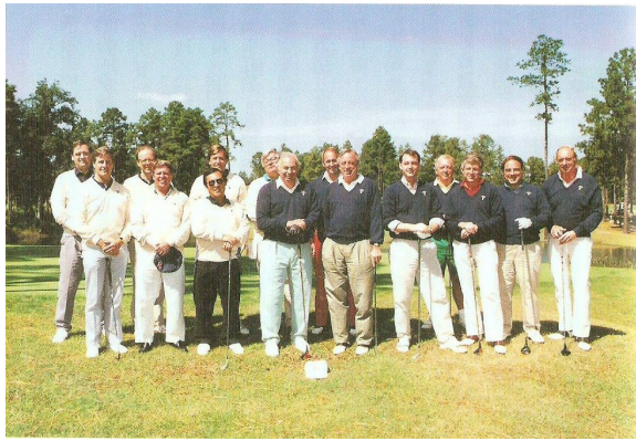
大前研一總是很輕易的跟外國人相處在一起

不同於你對一般日本人的認識，大前研一沒有一口日本腔的英文、不像一般日本人那樣靦腆害羞，相反的，他總是能輕易的跟外國人相處在一起，這樣的能力是在大學時，擔任口譯員工作所建立的。