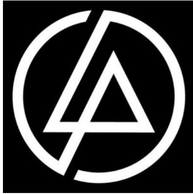
Linkin Park樂團標誌