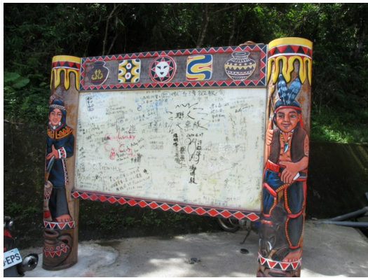
壽卡頂點車友的簽名區，來征服時記得準備奇異筆，因為派出所是借不到的喔!(攝影/羅文婕)