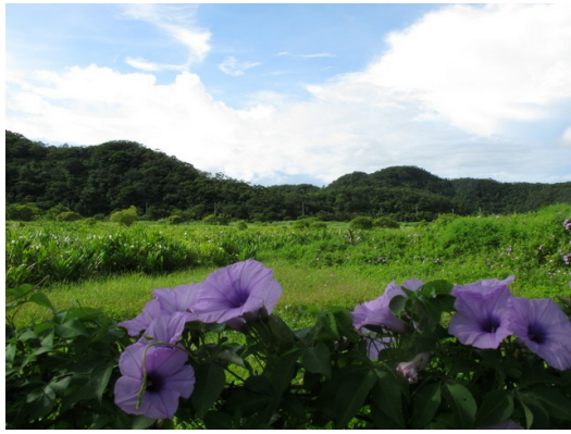
屏東往台東的東源村部落，原始又美麗的景觀彷彿世外桃源， 沿途百花綻放，故在車友之間有著"最香的腳踏車道"之稱。