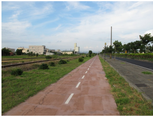
近年，受道單車樂活風潮的影響，許多地方政府開始規畫專屬的腳踏車步道。 這條位於台中縣的路不但平穩，沿途景色怡人，騎在上面相當舒適愜意。