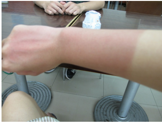
旅程時值盛夏七月，一不小心沒做好防曬就會被太過熱情的太陽吻傷。