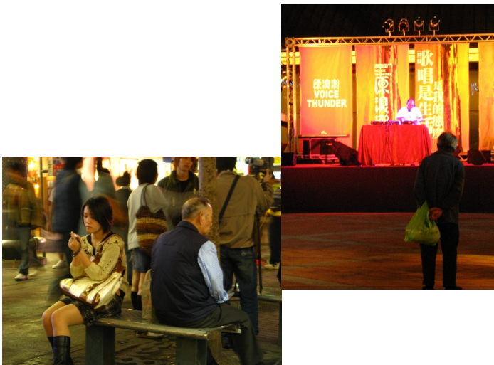
▲新舊文化的融合，造就出西門町獨特的面貌。