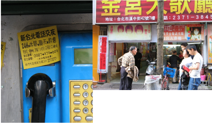
▲寂寞，在每個年代都有各自的解決之道。