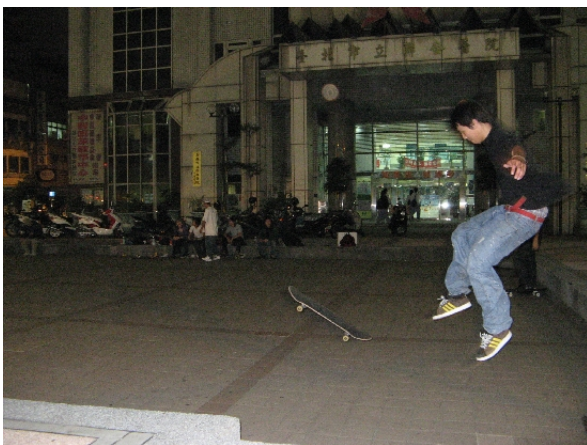
▲建於日據時代的性病防治所，其廣場成了青少年練習滑板的最佳地點。