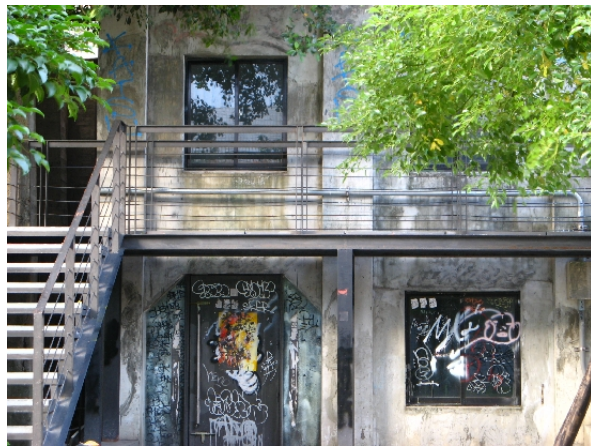
▲角落一座公園裡的廢墟，門和窗都被噴上滿滿的塗鴉。

百年歷史，讓西門町矛盾卻出奇自然地融合新舊文化，老年人坐在街頭回憶青春；青少年穿梭巷弄製造回憶。西門町，承載了好幾世代的共同情感。