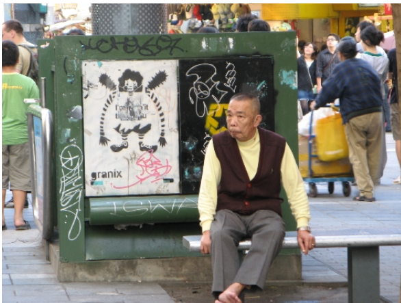
▲ 坐在街頭一隅的老人。