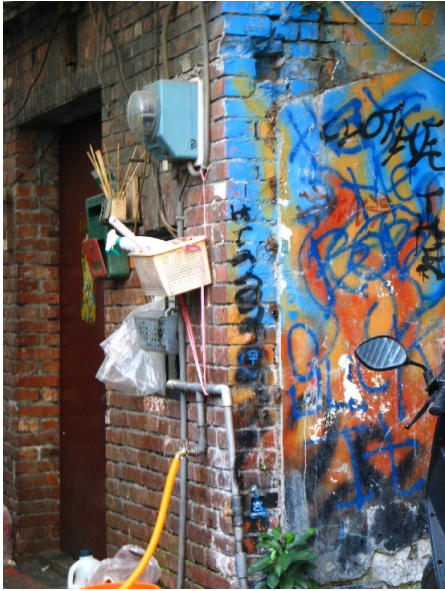
▲磚瓦與塗鴉的組合，在西門町的小巷子裡看起來是那麽地理所當然。