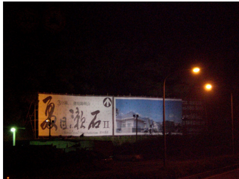
▲來自日本的夏目漱石為人優雅而又樂觀。 這或許是對於台灣人民的一種警惕，是似非似的異國文化讓我們感受到一股前所未有的睿智。