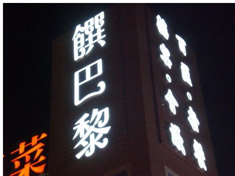
▲或許台灣美食名滿天下，然而饌的不僅只是食物，抑或是一種生活態度。 有別於快炒九九的滿腔熱情，巴黎的熱情總是暖暖內含光的文火慢燉。