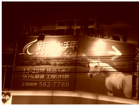
▲神秘中東有杜拜，而台灣也有創造經濟奇蹟的新杜拜。