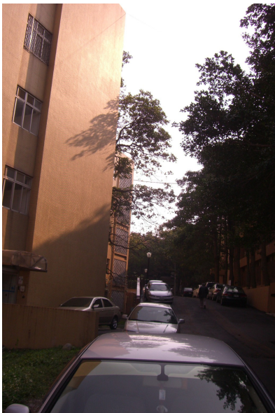
▲天色漸黑，路燈稀少的「異世界」又將成為陰暗的代名詞。耳際邊工人、機械的運作聲也漸歇息。

目前這個區劃正屬於整修的過程，土木工程系的館也將在近年內竣工。然而，經此「觀照」下，「異世界」在觀瞻與安全性上確實有待加強，儘管少有外賓會進出此地，但因為有漸多的女學生出入、且土木系館的完工也在眉梢之際，對於整修、清潔方面所必須改進的部分，實在可說是箭