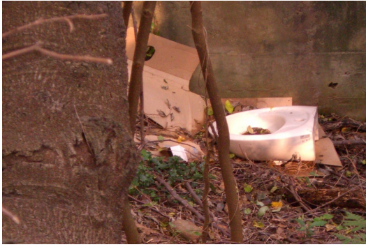
▲驚險之際，廢棄的馬桶，該說是好笑，還是可笑？