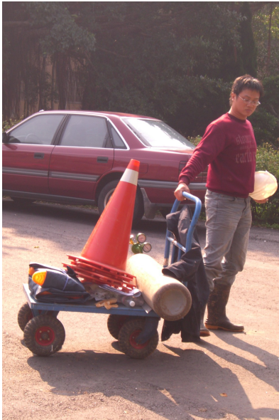
▲工人拖著沉重步伐推送工程用具，身影隨工作時間而漸漸拉長、模糊……