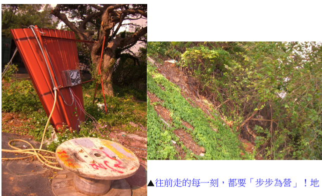
▲往前走的每一刻，都要「步步為營」！地上的施工雜物可能無形中成為阻礙(左)，到了最邊緣，更要小心了！跌落懸殊之差的深谷可不是玩笑話了！