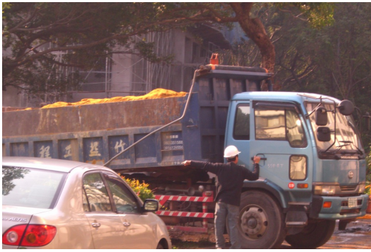
▲指揮停車的工人用高分貝嗓音吆喝著：「彼邊啦！嘿啦！彼邊啦！」(台語)