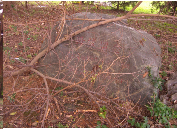
▲「異世界」通道的左手邊是一片雜草蔓生的榕樹曠地(左)。一片荒蕪之中，赫見一塊提有「母校紀念」等字樣的石塊(右)，除了被寫著現場操作盤的電控箱擋住外，歷史見證也活生生被枯枝殘骸遮蔽地不清不楚。