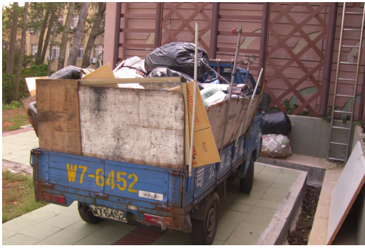
▲美麗的建築後，一輛乘載廢棄物的小型卡車，理所當然地佔滿所有視線。