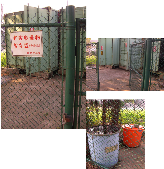
▲「異世界」的正前方，是一綠色圍欄的禁區。所謂的「有害廢棄物暫存區」，竟是門戶大開、人人可入的「景點」(左、右上)。裡頭老舊的回收桶上，淤積已久的死水，不正是蚊蟲滋生的溫床(右下)？