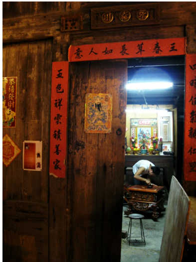
▲走進巷道的第一戶人家，便是擁有150年歷史的「永川大轎」，應接不暇的生意，讓屋內的弟子在夜裡連忙趕工。