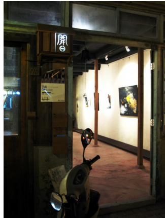
▲同一條街上，門內的景像不是只有神龕佛像，還有許多後現代精神的藝術展覽中心和文史工作室。