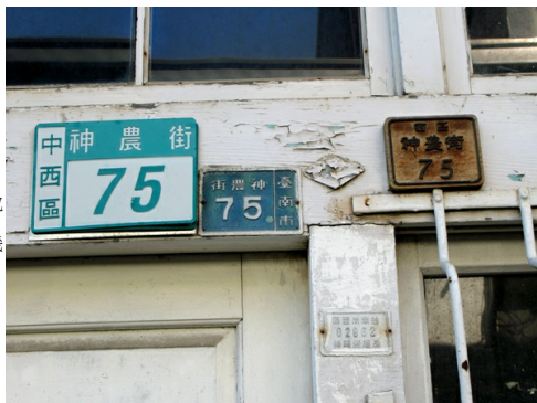
▲三代同堂的門牌地址，未來還能傳承幾代呢？