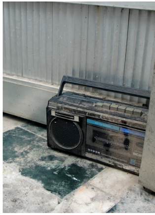
▲老式門把，窺視著百年來周遭的時空物移；路旁廢棄屋內，偶然丟棄著年久失修的卡式錄音機。