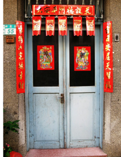
▲歷經百載，隨著不同朝代留下風格迥異的大門，唯一不變的，是那對門簾。