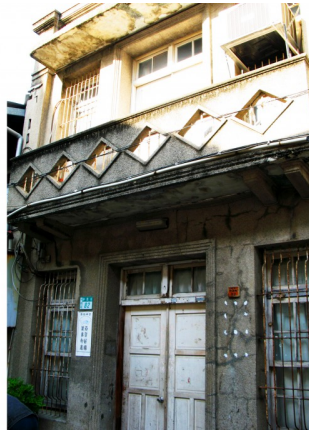
▲神農街兩旁一間間兩層樓高的房子，是當時為了往來的郊商巨賈而設計的，一樓作為洽談生意的店面；二樓則為存放貨物的倉庫。