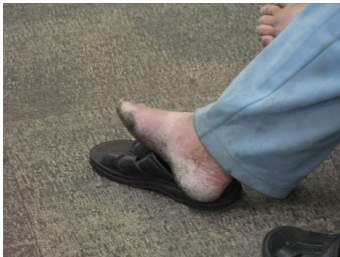
▲長滿厚繭、污垢的雙腳，不知走了多少路？歷經多少冷暖？