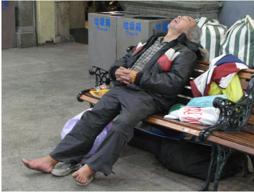
▲讓乘客們等火車的長椅，是遊民們最舒適的床。

擁有百年歷史的新竹火車站，建於日治時期，莊重優雅的設計讓這兒成了新竹最重要的地標和門戶。然而，不知從何時開始，遊民逐漸佔據車站，對於沒有生活能力的他們來說，這裡有廁所、有屋簷，或許就是天堂。