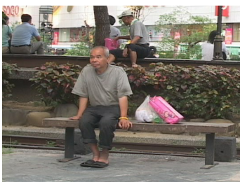
▲遊民們偶爾坐在車站前的廣場發呆。