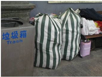
▲幾包袋子裝了遊民們所有的家當