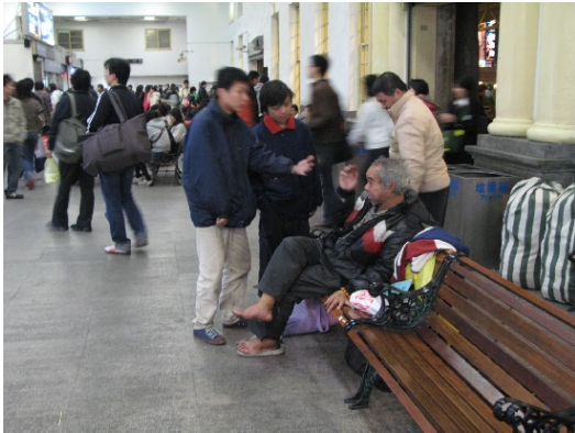
▲車站附近的流氓和這位遊民說：「走，我帶你到有遮風避雨的地方。」不知心裡打的是什麼主意。