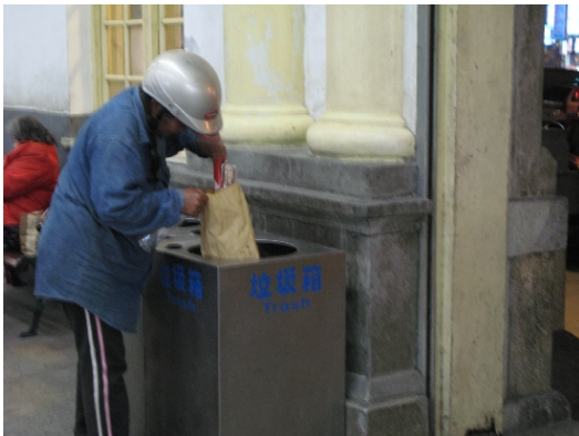
▲垃圾箱是遊民們食物的來源之一