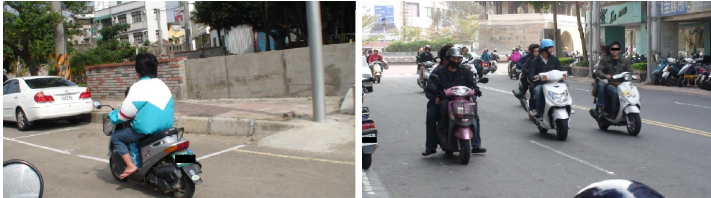
▲為什麼騎機車可以不戴安全帽？這個現象在新竹見怪不怪。