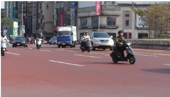
▲機車駕駛人無視地上「禁行機車」的標示，公然在快車道行駛，不顧及自己生命安全之餘，也罔顧他人安危。