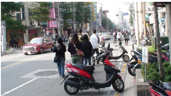
▲既然可以亂停車、不戴安全帽騎車，在「禁行機車」路段上騎機車。那行人走在馬路上也不是很過份吧？