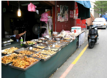
有的店家甚至是用鐵皮屋搭蓋而成，鐵皮屋上也已被貼著出租廣告，儼然像個工地。