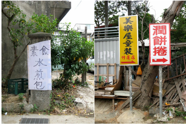
隱密的那條巷子裡尚有一些店家在營業，店家們為了增加客人量，選擇在巷口插上招牌以吸引人氣，也形成一種特殊景象。