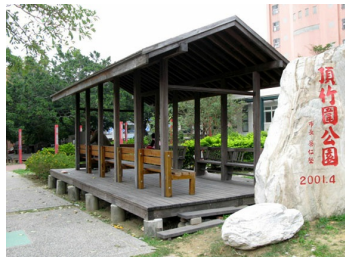
竹蓮市場不只有便民的停車場，附近更有三個小公園可供民眾休憩、散步，自成一個小社區。