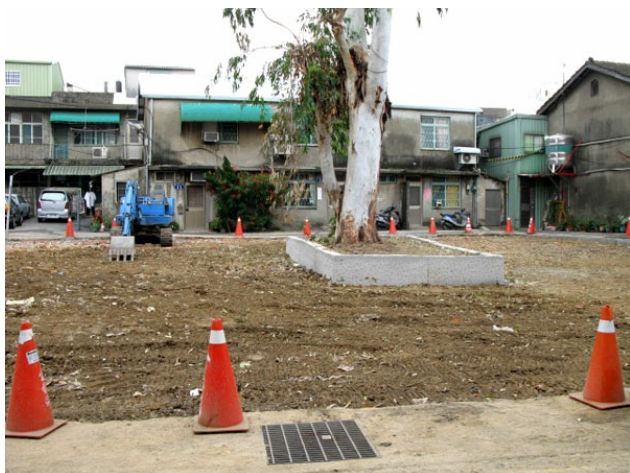
市場旁另一邊較隱密的巷子，是尚待施工的工地，旁邊也是一些舊房子，相較於竹蓮市場的完善與便利，形成一種對比。