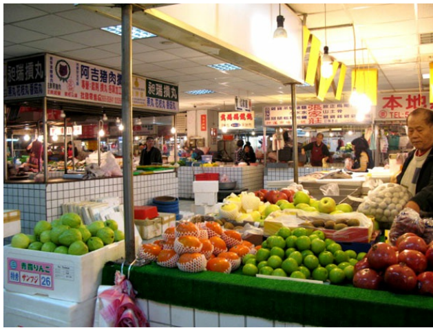
裡面的攤販因為經過設計與管理，也都乾淨而井然有序，但精心規劃之下，卻失去了一點傳統市場特有的味道。