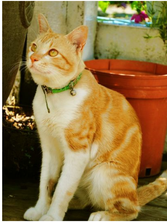
陽光下，靜靜思索，守望幸福。