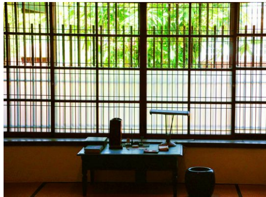
在擁擠的人群中，只要用心，也能守護住自己的那份寧靜。