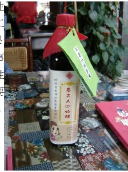
日日春關懷協會輔導娼妓自釀的四物醋產品。