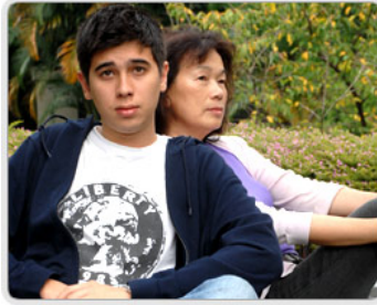
龍應台與安德烈，經由書信互相了解彼此。

龍應台在第一封信中，就直問安德烈：你們這一代關懷的是什麼？「定錨」的價值是什麼？而安德烈的回答是：「我們這個年齡的人阿，每個人都在走自己的路，每個人都在選擇自己的品味，搞自己的遊戲，設定自己的對和錯的標準。一切都是小小的、個人的，因為，我們的時代已經不再有『偉大』的任何特徵。」這正是現代年輕人的「困境」。